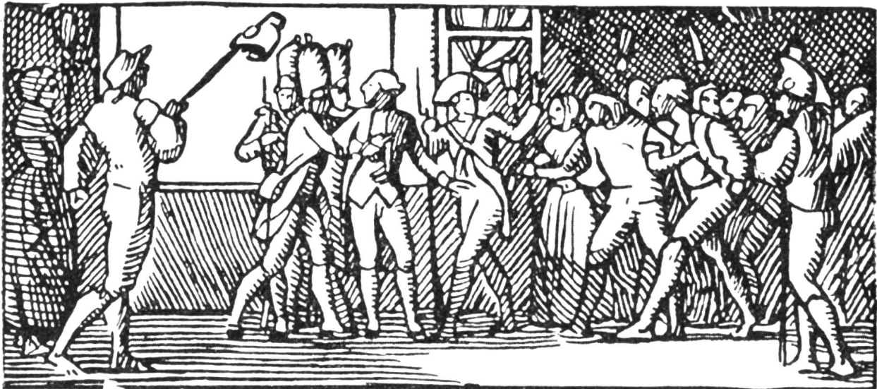
Französisches Volk setzt Ludwig XVI. die Freiheitsmütze auf.