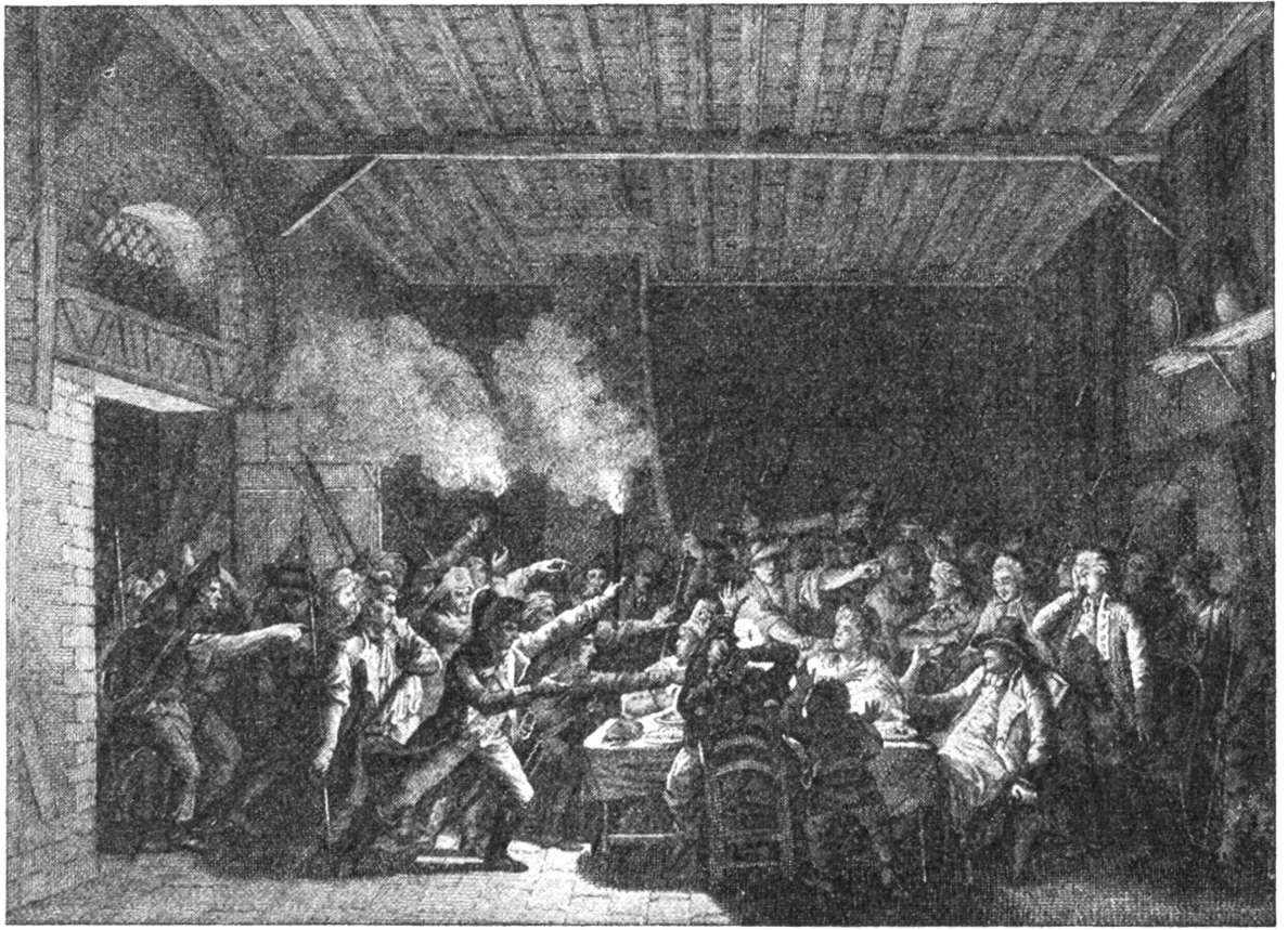
König Ludwig XVI., der mit seiner Sa- milie aus Paris ge- flohen, wird im Wirtshause zu Da- rennes von den Re- volutionären ge- fangen genommen (22. Juni 1791).