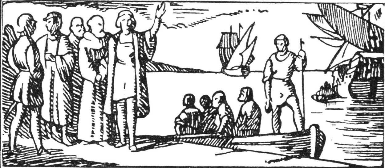
Kolumbus verläßt Spanien zu seiner ersten Entdeckungstreife.

1481 Stanser Verkommnis, Nikolaus von Flüe als Friedensstifter. Freiburg und Solothurn werden in den eidgenössisch. Bund aufgenommen.