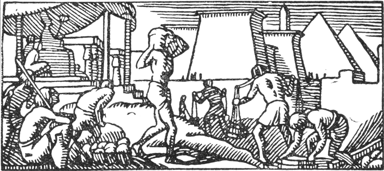
Ägypter beim Pyramidenbau.