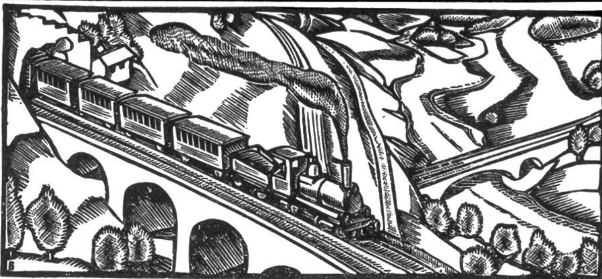
Die 1882 eröffnete Gotthardbahn hat 80 Tunneln und Galerien von zusammen über 46 km Länge und 1234 Brücken und Durchlässe. Sie fährt seit 1920 elektrisch.