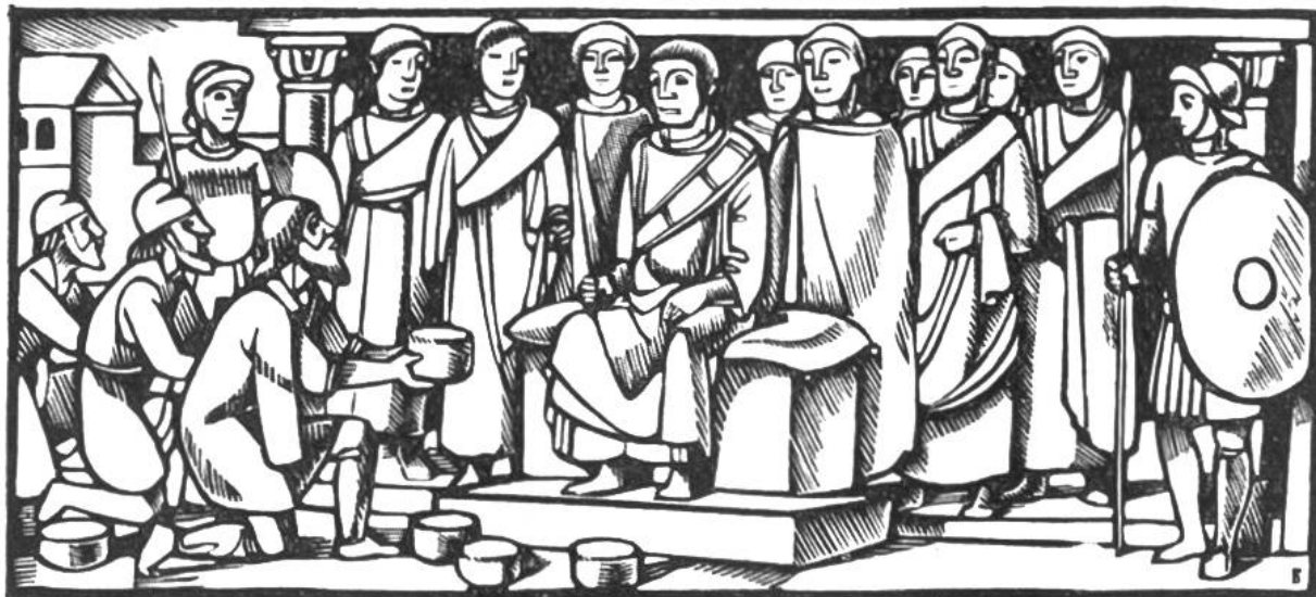
Konstantin der Grosse (306–337) nimmt die Gaben tributpflichtiger Völker entgegen.

oberung Galliens durch Julius Cäsar. 49–45 Bürgerkrieg zw. Cäsar u. Pompejus. Triumvirat. 44 Ermordung Cäsars. 30–476 n. Chr. Rom unter Kaisern. 29 Augustus röm. Kaiser. Blüte der römisch. Literatur. Virgil, Ovid, Horaz, Titus Livius. Nach Christus. 9 Der röm. Feldherr Quintilius Varus wird vom Cheruskerfürsten Arminius (Hermann) im Teutoburgerwalde besiegt. 64–311 Zeit der Christenverfolgungen durch verschiedene römische Kaiser. 69 Helvetischer Aufstand, Julius Alpinus. 313 Kaiser Konstantin erhebt das Christentum z. Staatsreligion. 337 Teilung des röm. Reiches. 375 Beginn d. Völkerwanderung.