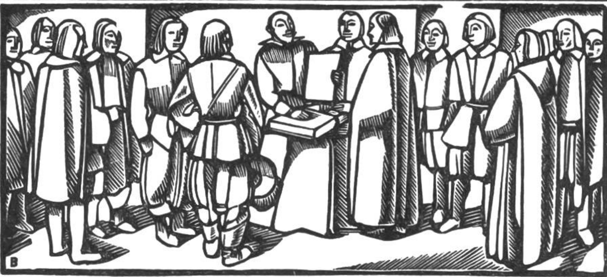
Der Westfälische Friede beendet den Dreissigjährigen Krieg; er wurde am 24. Oktober 1648 zu Münster in Westfalen geschlossen.