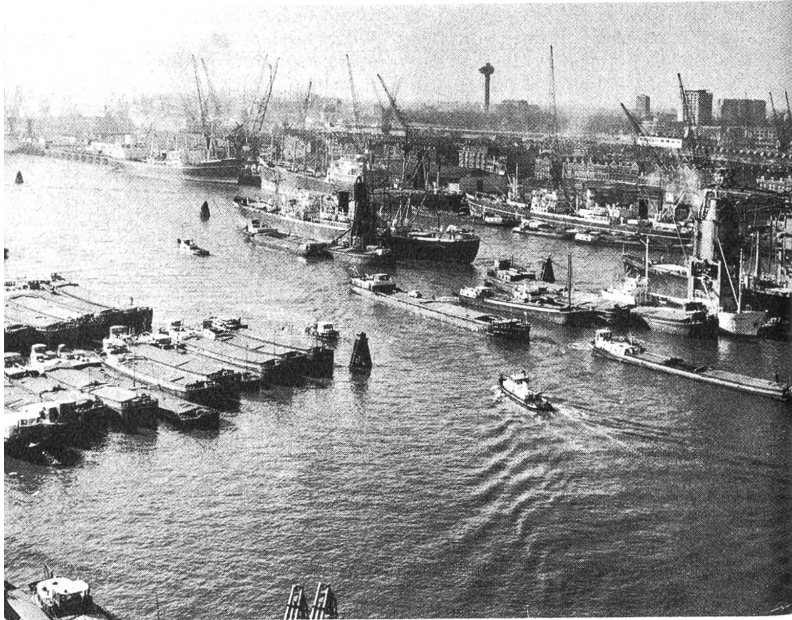
Regel Verkehr herrscht in den Hafenbecken von Rotterdam. See und Fluss-schiffahrt verknüpfen sich. Die Riesenstadt im Hintergrund, die mit ihren Vororten über eine Million Einwohner zählt, lebt von der bevorzugten Lage in einem der Brennpunkte des Welthandels.