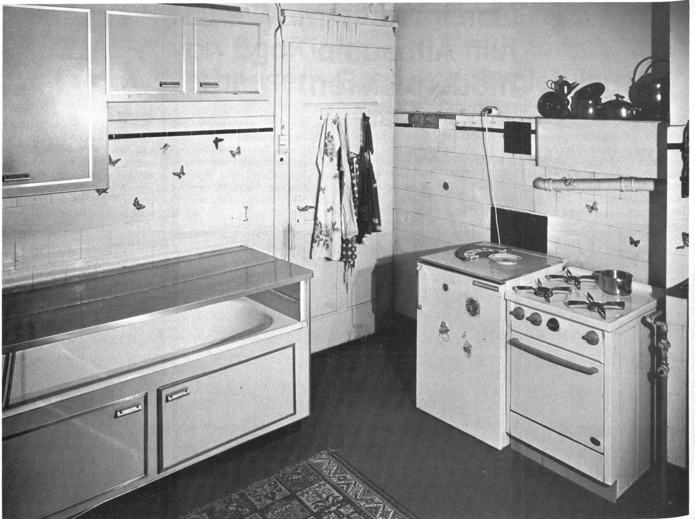
Die Küche desselben Hauses vor dem Umbau.

Das Modernisierungsziel beim Altbau ist die Herstellung eines mit Neubauten äquivalenten Komforts bei gleichzeitiger Erhaltung bzw. Sanierung der Bausubstanz. Die Energieversorgung für Heizen, Warmwasserbereitung, Waschen, Kochen usw. muss also einerseits nach denselben Kriterien wie im Neubau gewählt werden: Wirtschaftlichkeit, Versorgungssicherheit, Zukunftssicherheit, niedriger Energieverbrauch. Andererseits muss man sich beim Altbau dem Bestehenden anpassen: Platz- und Placierungsfragen erhalten erhöhte Bedeutung; allfällige historische Fassaden oder Dachstöcke erschweren die Installation energiesparender Heizsysteme wie zum Beispiel Luft/Wasser-Wärmepumpen.