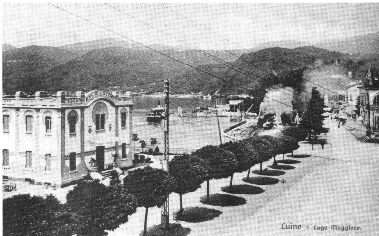
Una delle bische notturne de «Il piatto piange»

Chi vuol avvicinarsi troppo a interessi giganteschi, rischia di perdere tutto, a meno che non sia prevenuto e appartenente al gruppo degli iniziati. Dopo aver capito che dietro ai quattro o cinque si cela una potente organizzazione come quella della massoneria, dove solo gli adepti possono governare e attingere al calice della saggezza, dove il 'tempio' è fatto di uomini e non di pietre, la piramide del potere a Luino appare in un primo tempo indistruttibile e resistente agli attacchi dell'ideologia fascista, finché non si estinguerà definitivamente la vecchia guardia dell'aristocrazia luinese e la guerra seppellirà quell' ancien regime sotto le macerie.