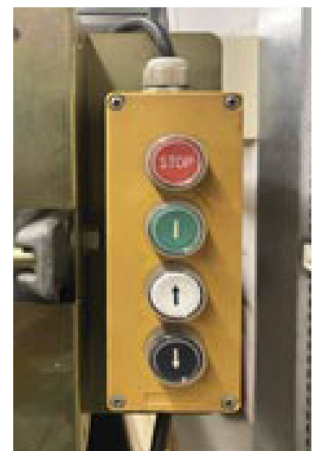
Le monte-charge de secours du magasin