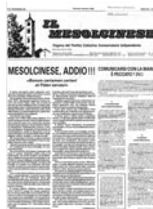
Il Mesolcinese du 1.12.1989

Dans le nouvel environnement numérique, les questions liées au droit d'auteur et à la protection des données touchent beaucoup plus directement les bibliothèques et les institutions patrimoniales. La BN a répondu à cette situation en augmentant le personnel de l'état-major consacré au droit d'auteur et à la protection des données, créé en 2020 et qui a été renommé en 2021 état-major Droit et bibliothèques. Grâce à l'élargissement et la réorganisation de cet état-major, la plupart des petites et grandes questions de droit touchant spécifiquement les bibliothèques ont pu être traitées par des spécialistes de la BN qui connaissent aussi bien ces thèmes que les particularités de l'institution.