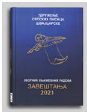
Zaveštanja: zbornik književnih radova, 2021

Le passage, antérieur, au nouveau système de bibliothèques et les mesures pour endiguer la pandémie ont entraîné un retard dans le catalogage alphabétique touchant plus de 10 000 documents. Une procédure accélérée d'intégration a cependant été mise en place afin que ces documents puissent malgré tout rapidement être conservés correctement dans le magasin et mis à disposition des usagers. Pour les documents dotés d'un numéro ISBN, les données bibliographiques sont