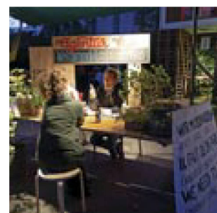
Quartier des musées de Berne : fête d'été