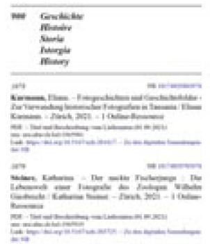
Extrait du Livre suisse , fascicule 17, 2021

Le nombre de renseignements et de conseils fournis a été légèrement supérieur à 9 000, ce qui représente une baisse de 25 % (12 000 en 2020). En outre, 2 237 recherches approfondies ont été effectuées pour les usagers et usagères, ce qui correspond à une baisse de 20 % (2 805 en 2020). Des recherches approfondies consacrées à la nutrition et au 50 e anniversaire du droit de vote des femmes ont été effectuées en lien avec les deux expositions de la BN ( Viande – Une exposition sur la vie intérieure et Votez! Sur le droit d'avoir une voix ). Pendant la fermeture occasionnée par le coronavirus, les renseignements ont été délivrés aux utilisateurs et utilisatrices par courrier postal et par scans numériques.