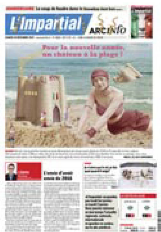
L'Impartial du 30.12.2017

Depuis août 2021, la BN offre une place d'apprentissage en médiamatique.