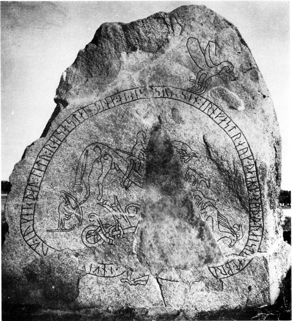
Abb. 3: Stein von Böksta (Balingsta sn, Uppland, Schweden).