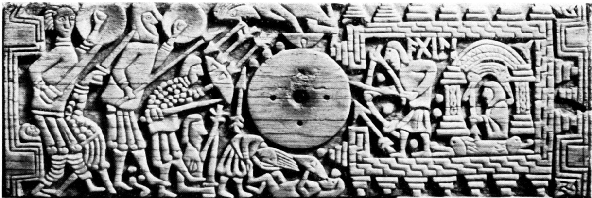
Abb. 2: Das Kästchen von Auzon. Egilplatte (Kampfszene).