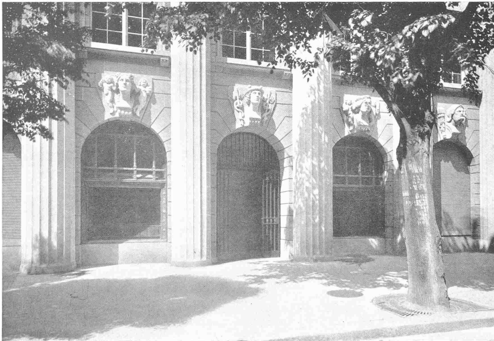
OBEN FASSADE 1 : 250