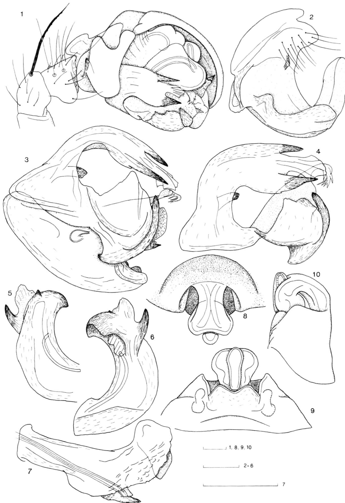
Fig. 1-10: Leptyphantes sobrius (THORELL). 1 ♂-Palpus von retrolateral. 2 Paracymbium. 3 Endapparat von ventral/retrolateral. 4 Lamella und Terminal Apophysis von retrolateral. 5, 6 M. Apophysis. 7 Embolus von retrolateral. 8, 9, 10 Epigyne von ventral, aboral und lateral. Masstäbe: 0.10 mm.