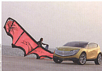
Mazda (Suisse) SA

Am vergangenen Frankfurter Automobilsalon wurde der diesjährige Preis für die von Mazda Motor Europa geschaffene Insel «Nagare» in der virtuellen 3-D-Internet-Welt «Second Life» vergeben. Nagare Island wurde von Mazda Anfang Jahr entworfen, um bei Kite-Surfen – also bei Surfern, die sich von einem Lenkdrachen ziehen lassen – für den Mazda Hakaze zu werben. Die