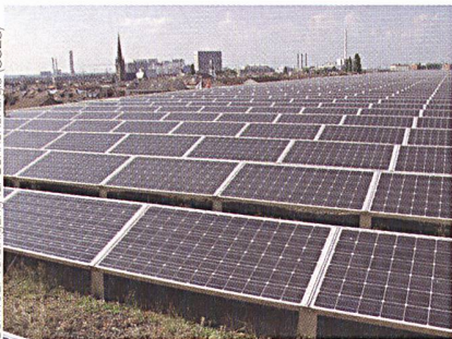
In Deutschland sind bereits rund 3 GW Fotovoltaikleistung installiert; die Schweiz liegt bei rund 30 MW. Im Bild: Fotovoltaikanlage mit 240 kWp auf dem Gründach der Messe Basel (2400 Siemens- SM-110-Panels, 7 Wechselrichter, Jahresertrag 220 000 kWh).

Solarstrom auf die Stromnetze hat und wie man diese Mengen noch erhöhen kann.