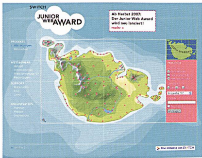
Auf der Website www.juniorwebaward.ch können durch Klicken auf die roten Punkte die eingereichten Projekte der einzelnen Schulklassen eingesehen werden.

Letztes Jahr wurde der Switch Junior Web Award erstmals ausgeschrieben. Die Idee, dass Schulklassen ihre eigene Website erstellen und im Internet veröffentlichen, fand breiten Anklang: Mehr als 100 Klassen mit rund 2000 Schülerinnen und Schülern kreierten 119 Websites. Sie lernten dabei den Umgang mit dem Internet, den Programmen und der Sprache und konnten Erfahrungen zum Thema Datenschutz