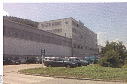
Enics expandiert weiter nach Osteuropa, mit einer Beteiligung an einem Werk von ZTS in der Slowakei.

Enics übernimmt Vermögenswerte von ZTS Elektronik in der Slowakischen Republik. Mit dieser Akquisition expandiert die Badener Firma weiter nach Osteuropa. «Aufgrund unseres Wachstums haben wir einen passenden Ort gesucht, um zusätzlich zu unserem Werk in Elva (Estland) unsere Präsenz in Osteuropa zu stärken. Die Slowakische Republik ist für uns dank ihrer zentralen Lage eine ideale Lösung – sie liegt nahe an den grossen Märkten Mitteleuropas und bietet gleichzeitig ausgezeichnete