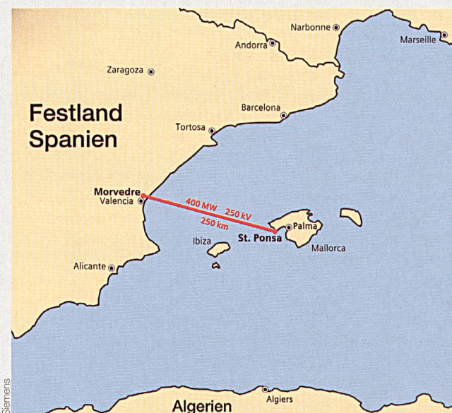
Die 250 km lange Seekabelverbindung wird von Mai 2011 an zwischen Morvedre bei Valencia und Santa Ponsa bei Palma de Mallorca 400 MW mit einer Übertragungsgleichspannung von 250 kV verlustarm übertragen.

Durch den Zugang zum Elektrizitätsmarkt des spanischen Festlandes kann der Spitzenlastbedarf der Insel vor allem in den heißen Sommermonaten – also zur Hauptferienzeit – zum ersten Mal durch Stromimporte aus dem europäischen Verbundnetz gesichert werden, der aus einem Energiemix von regenerativen und konventionellen Energiequellen besteht. Pro Jahr lässt sich so der Ausstoss von über 1,2 Megatonnen CO 2 vermeiden, die sonst beispielsweise durch den Bau eines neuen erdölbefeuerten 400-MW-Kraftwerks auf Mallorca zusätzlich emittiert würden. ( Siemens/Sz )