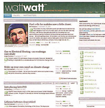
Die Homepage der neuen Website www.wattwatt.com .

Viele sind über die Auswirkungen menschlichen Handels auf das Erdklima besorgt und wüssten gerne, was der Einzelne dagegen unternehmen kann; Experten aus den verschiedensten Gebieten der Elektrotechnik haben innovative Verbesserungsvorschläge, wie der menschliche Einfluss reduziert werden kann: Für all jene hat die International Electrotechnical Commission (IEC) eine neue und unabhängige Internetplattform aufgebaut, auf welcher Diskussionen über elektrische Energieeffizienz geführt werden können.