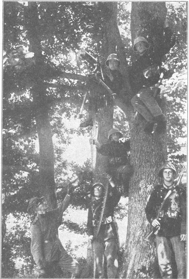
Maschinengewehr auf einem Baum Mitrailleuse en position sur un arbre.

die Abrüstung des bürgerlichen Staates zu propagieren), sie lehnen, und vor allem die religiös «Erleuchteten» unter ihnen, nicht etwa nur in einem ganz besonderen Falle eine Unterwerfung unter das Gesetz, das Recht ab, sondern sie erheben den grundsätzlichen Anspruch, jedesmal, wenn der Staat, die Gemeinschaft, eine Forderung an sie stellt, von sich aus zu entscheiden, ob sie den Vorschriften des konkreten Rechtes gehorchen wollen oder nicht. Ungehorsam, Feigheit und Verrat versteckt sich bei ihnen hinter das Gewissen! Welch' ungeheuerlicher Anspruch! Kann sich doch jeder andere Rechtsbrecher, mit dem gleichen Recht «auf sein inneres