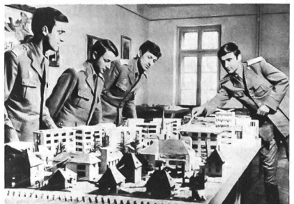
In der Offiziershochschule «Nicolae Balcescu» studieren angehende Offizierschüler anhand von Stadtmodellen die Führung von Sturmeinheiten bei Strassenkämpfen.