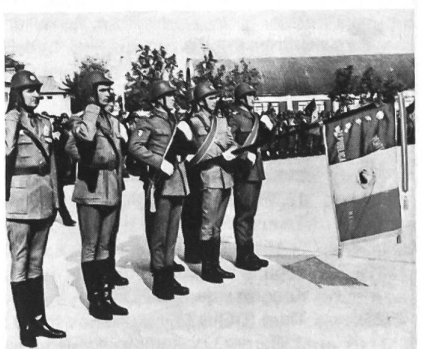
Seit 1973 haben die rumänischen Truppen neue Stahlhelme: Stahlhelme die einst die königliche Armee trug. Auch das Salutieren wird nicht mehr nach sowjetischem Muster geübt, sondern nach den Gepflogenheiten der Vorkriegsarmee.