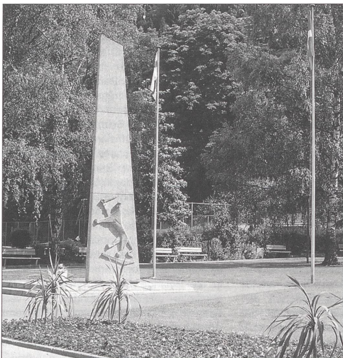
Die Marschall-Mannerheim-Gedenkstätte in Montreux-Territet.

Der finnische Marschall Carl Gustaf Mannerheim hat seine letzten Lebensjahre in Glion oberhalb von Montreux verbracht und starb am 28. Januar 1951 im Kantonsspital Lausanne. Die Marschall-Mannerheim-Gedenkstätte in Montreux-Territet, unmittelbar am Seeufer gelegen, wurde am 14. Mai 1955 feierlich enthüllt. Präsident des Ehrenkomitees zur Schaffung der Gedenkstätte war kein Geringerer als der Oberbefehlshaber unserer Armee während des Zweiten Weltkrieges, General Henri Guisan, der bei der Einweihung des Denkmals persönlich die überragende Persönlichkeit seines Freundes Marschall C.G. Mannerheim in bewegten Worten würdigte.