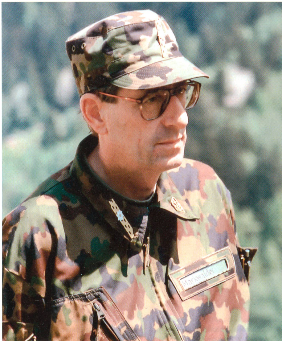
Alfred Markwalder als Brigadekommandant.

war Stabschef der Gebirgsdivision 9 sowie schliesslich auch nebenamtlicher Kommandant der Festungsbrigade 23 – der Gotthard-Brigade – als Brigadier. Ich durfte viele intensive und schöne Momente im Rahmen meiner Dienstleistungen für die Armee und für die Schweiz erleben.