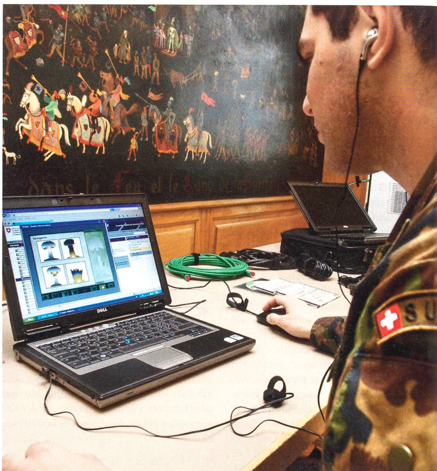
Der Lernende kann den Stoff mit Text, Bild und Ton durcharbeiten.

Das Gros der Lerninhalte wird von den Lehrverbänden (LVb) gestaltet. Nach dem LVb Flieger 31 und den Kadernschulen der