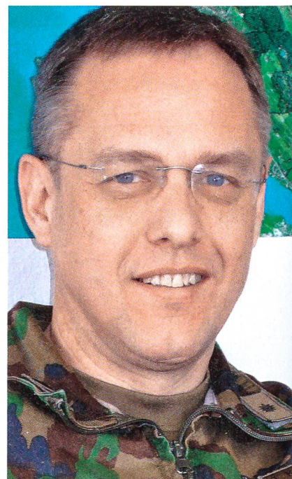
Oberst i Gst Thomas Kaiser.

E-Learning als Alternative zum Frontalunterricht ist nicht nur zeitgemäss und motivierend, sondern entlastet auch den Ausbilder. Wiederkehrende Theorien müssen nicht mehr hundertfach und immer wieder in der ganzen Armee neu erfunden und vermittelt werden. Eine Lektion wird einmal entwickelt und steht dann landesweit als einheitlicher Lerninhalt zur Verfügung. Und damit komme ich zurück auf Ihre Fragestellung: E-Learning trägt bei, die Effizienz und Qualität der Ausbildung anzuheben.»