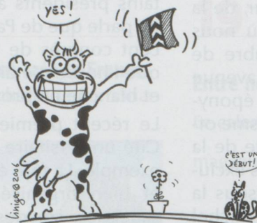
FONDS SUISSE POUR LE PAYSAGE: ÉCOLOGIE URBAINE À NEUCHÂTEL !

■ Créé pour le 70 e anniversaire de la Confédération, le Fonds suisse pour le paysage (FSP) a déjà soutenu plus d'un millier de