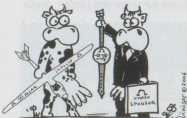
M. PICCARD, EN CADEAU UNE MONTRE POUR TENIR LES DÉLAIS !

■ Le projet Solar Impulse de Bertrand Piccard (tour du monde en avion solaire) vient de trouver un nouveau sponsor. La