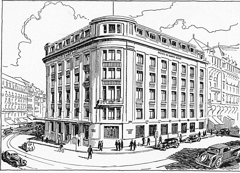
Hôtel de la banque à Genève — Bankgebäude in Genf