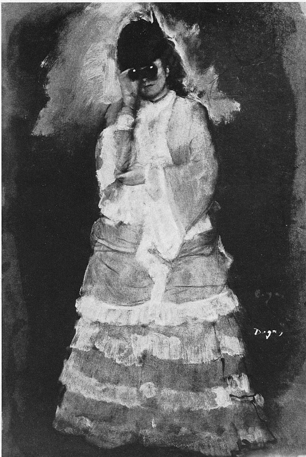
▲ Edgar Degas (1834–1917): Dame mit Opernglas ● La dame à la lorgnette Dama col binocolo ● Lady with Opera Glasses