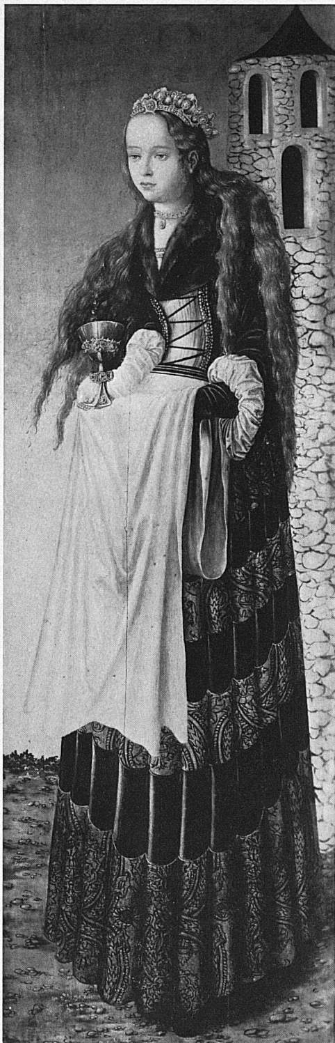
▲ Lucas Cranach d. Ä. (1472–1553): Heilige Barbara Sainte Barbe ● Santa Barbara ● St. Barbara