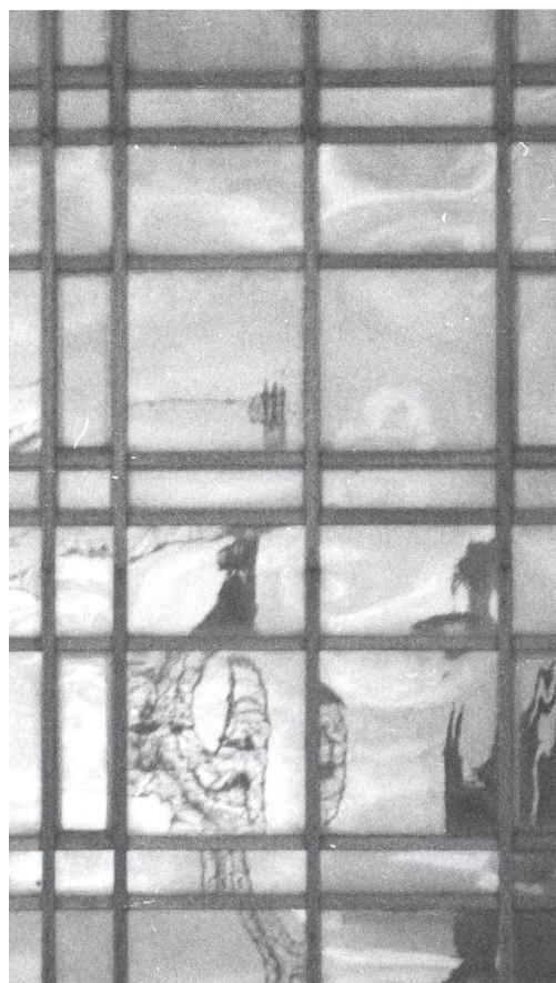
Ausschnitt aus der Hauptfassade des Palasts der Republik, (Foto: Phillip von Kap-Herr, 1999)

„Einschneidende Änderungen des alten Stadtbildes dürfen nur aus praktischen Gründen, niemals aber aus ästhetischen Gründen erfolgen. Denn die ästhetischen Gründe unterliegen der Wandlung, und da wir bisher immer unrecht gehabt haben, werden wir in alle Zukunft unrecht haben. Aber die bessere Einsicht kann zerstörte Kulturdenkmäler nicht wieder aufbauen.“ Adolf Loos 1