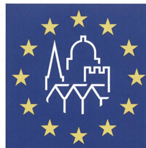
Abb. 2 Logo der «European Heritage Days» der «Europäischen Denkmaltage».