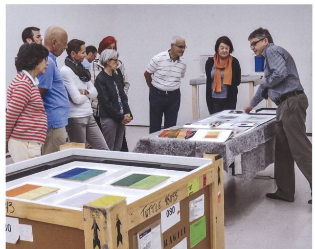
Abb. 7 Das reichhaltige Programm ist nur dank der aktiven Mitwirkung der Zuger Museen und weiterer am Kulturerbe interessierter Organisationen möglich. Eben erst erstellt und bereits ein «Denkmal»: Der innovative Stampflehm-Turm auf dem Areal des Ziegelei-Museums zog 2021 scharenweise Besuchende an (links). Im Kunsthaus Zug wird 2015 erklärt, wie Kunst- und Sammlungsgegenstände in Transportkisten verpackt werden (rechts).