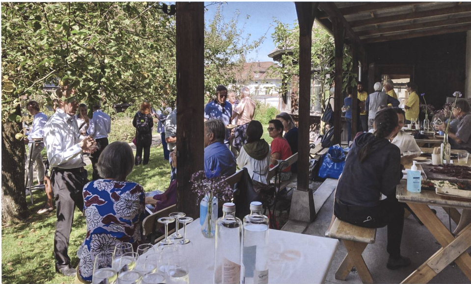
Abb. 8 Jeweils im Rahmen eines Apéros oder einer Festwirtschaft kommen die verschiedenen Akteure und Anspruchsgruppen miteinander ins Gespräch, so 2021 im lauschigen Garten des Klosters Maria Opferung in Zug.

ne zunehmende Bekanntheit der Veranstaltungsreihe trugen zum zahlenmässigen Zuwachs bei.