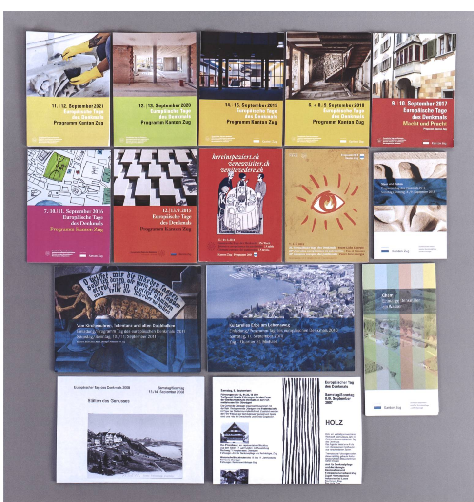
Abb. 3 Programmhefte der letzten 15 Europäischen Denkmaltage im Kanton Zug (2007–2021).

lich-thematischen Schwerpunkt, publiziert das aus mehreren Hundert Anlässen bestehende Programm im Internet sowie als Broschüre und betreibt die landesweite Werbung und Medienarbeit. 2 Die Durchführung der Anlässe liegt in der Verantwortung der vor Ort tätigen Ämter und Organisationen.