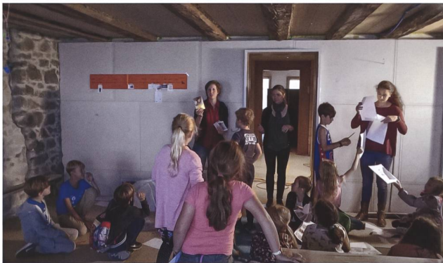
Abb. 10 Vermittlung des baukulturellen Erbes für Schulklassen. Mitarbeiterinnen der kantonalen Denkmalpflege erklären 2018 im ehemaligen Gasthaus «Zur Taube» den jungen Menschen die Bedeutung des baukulturellen Erbes.

baute Vergangenheit. Und letztlich sind bauarchäologische Untersuchungen in vielen Fällen Teil eines umfassenden bau- und denkmalpflegerischen Prozesses. Ganz im Sinne des kantonalen Denkmalschutzgesetzes, das den Begriff «Denkmal» ganzheitlich verwendet, ist dem Amt für Denkmalpflege und Archäologie im Sinne einer integralen Beschäftigung mit dem Kulturerbe wichtig, immer wieder auch Zugang zum archäologischen Kulturgut zu bieten. So erwiesen sich denn auch die Angebote zum Besuch von Rettungsgrabungen stets als eigentliche Publikumsmagnete (Abb. 9) 7 .