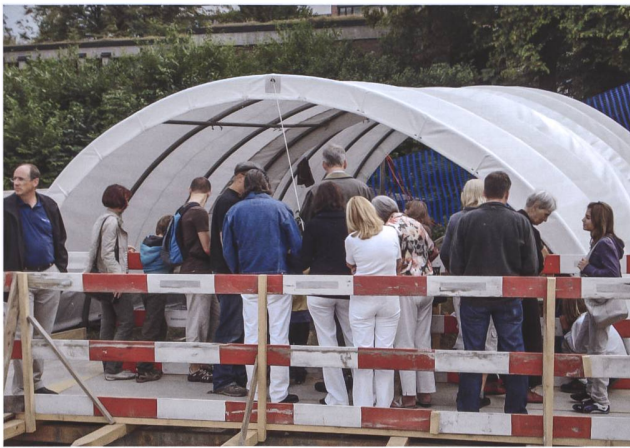
Abb. 9 Mit rund 1000 Besuchenden war der «Tag der offenen Ausgrabung» bei den prähistorischen Pfahlbauten im Cham-Alpenblick im Jahre 2009 die zahlenmässig erfolgreichste Einzelveranstaltung in der 28-jährigen Geschichte der Europäischen Denkmaltage im Kanton Zug. Angebote zum Besuch von archäologischen Ausgrabungen waren stets Publikumsmagnete.