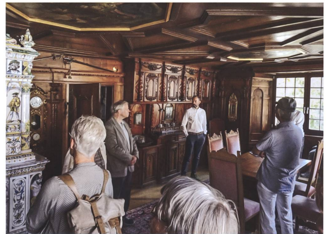
Abb. 6 Die Möglichkeit, private und sonst nicht zugängliche Räume zu besichtigen, zieht viele Leute an, z. B. im Jahre 2018 den Festsaal im Zurlaubenhof (links) oder die prächtige Täferstube im Kolinhaus (rechts).