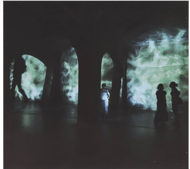
Abb. 5 Das Öffnen «verschlossener Türen» ist eines der Erfolgsrezepte der Denkmaltage. Im Jahre 2015 bot sich dem Publikum die Gelegenheit, ins Innere der 286 Meter langen Lorzentobelbrücke zu klettern (links), und 2020 konnten die Besucher in das geheimnisvolle unterirdische Wasserreservoir Oberallmig in Baar steigen (rechts).