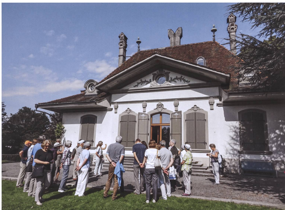
Abb. 1 Immer am zweiten Wochenende im September bietet sich schweizweit die Gelegenheit, hinter die Mauern unseres reichen Denkmälerbestandes zu blicken. Im Bild: «Täubmatt exklusiv – geheimnisvoller Garten hinter Gemäuer» (Cham, 2016).

Der Ursprung der Denkmaltage geht auf eine Initiative des früheren französischen Kulturministers Jack Lang zurück, der im Jahr 1984 die «Journées Portes ouvertes monuments historiques – Tage der offenen Denkmale» in Frankreich initiierte. Aufgrund des grossen Anklangs in der Bevölkerung rief daraufhin der Europarat die «European Heritage Days» ins Leben. Seither sind die Tage des Denkmals ein jährlich wiederkehrendes und europaweit durchgeführtes kulturelles Ereignis unter dem Patronat des Europarates und mit Unterstützung durch die Europäische Union (Abb. 2). Die Denkmaltage finden heute jährlich in 50 Ländern statt. In der Schweiz werden die Denkmaltage seit 1994 als nationaler Beitrag zu den europaweiten «European Heritage Days» begangen. Die Nationale Informationsstelle zum Kulturerbe (NIKE) setzt den inhalt-