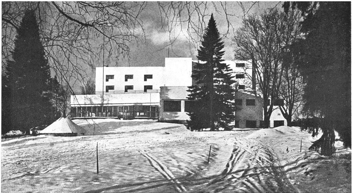
Ansicht aus Südosten