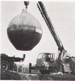
RAG-Panzertanks gibt es von 5000 l bis 12000 l Inhalt.

Bezieht man in einen Vergleich der verschiedenen Lagermöglichkeiten also auch die erforderlichen Sicherheitsbauten und -vorrichtungen mit ein, findet der Bauherr im RAG-Panzertank nicht nur eine finanziell günstige, sondern auch umweltbewusste und auf absolute Sicherheit ausgelegte Heizöllagerung.