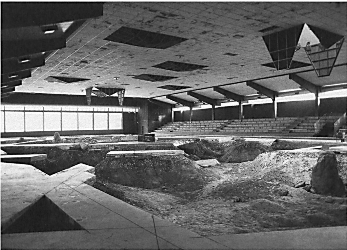
Pierre Huyghe: Augmented Reality in der Eissporthalle

tion von Aram Bartholl, deren Aufforderungscharakter man kaum widerstehen kann.