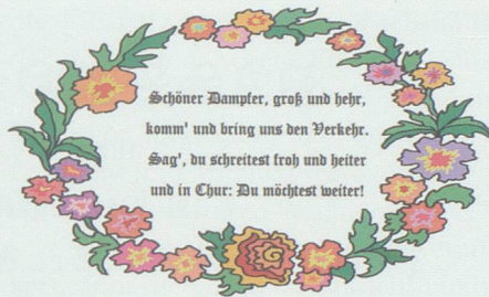
Begrüssungsvers in Sevelen für den Dampfzug anlässlich der Eröffnung der Eisenbahnlinie. Nachbildung Hans Hiller, mit Originalwortlaut