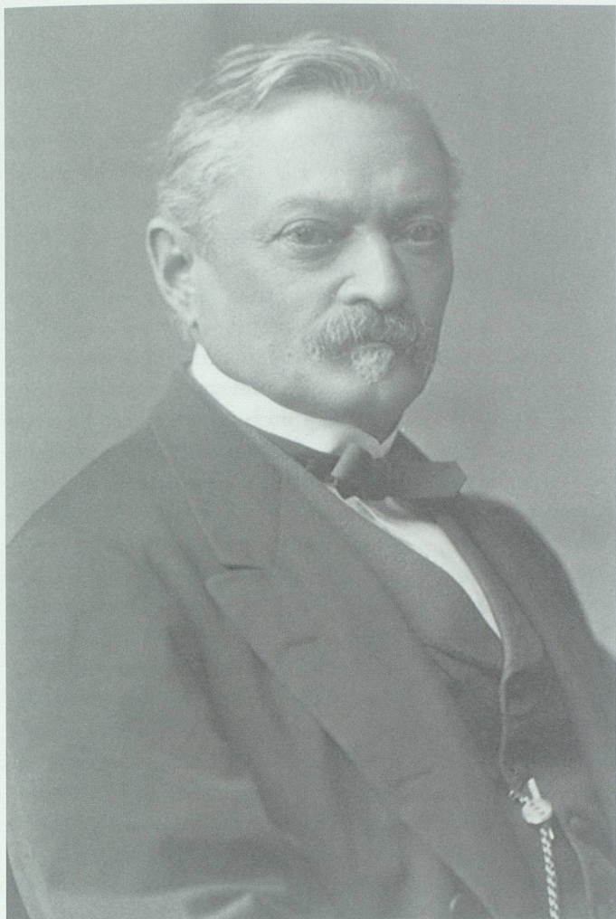
Arnold Otto Aepli (1816–1897), in der zweiten Hälfte des 19. Jahrhunderts der wohl am breitesten engagierte Schweizer Staatsmann.