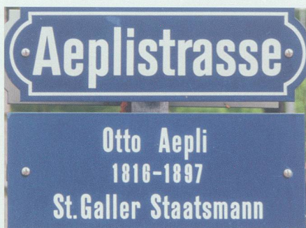
Die Aeplistrasse, eine parallel zur Langgasse verlaufende Quartierstrasse, erinnert in der Kantonshauptstadt an den «St.Galler Staatsmann» Otto Aepli.

Der Alpenrhein bereitete im ganzen 19. Jahrhundert schwerste Sorgen, wie man gerade auch im Werdenberg weiss. 1868 zum Beispiel bot sich im Rheintal der Anblick eines Sees mit der Fläche etwa des Thunersees! Ruhe kehrte erst im 20. Jahrhundert ein – trotz der vielen frühen Massnahmen und trotz des sukzessiven Einbezugs der zurückliegenden Gemeinden, des Kantons und des Bundes. Vor allem die St.Galler Regierungsräte Gallus Jakob Baumgartner, Matthias Hungerbühler und Otto Aepli haben sich auf Kantons- und Bundesebene laufend eingesetzt. Den östli-