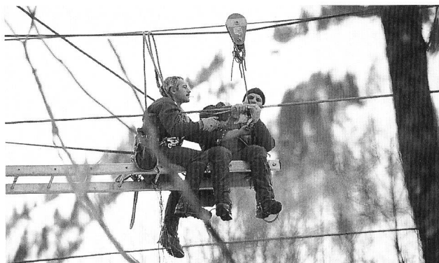
Bild 1. Aufräum- und Reparaturarbeiten im Schadengebiet der Fur-bachlawine zwischen dem Kraftwerk Tierfed und Linthal.

Eine weitere wichtige Verbundleitung der NOK – die am Fuss des Vorabgletschers vorbeiführende 220 000/380 000-V-Leitung zwischen dem Bündnerland und den Versorgungszentren des Mittellands – ist im Glarnerland den Lawinengewalten zum Opfer gefallen. Die innerhalb des Sernftals an mehreren Stellen zerstörte «Energies-trasse» bleibt für mehrere Monate ausser Betrieb, da die teilweise schwierigen topographischen Verhältnisse hier kaum Provisorien zulassen. NOK-Regionalleiter Züger rechnet denn auch damit, dass die Vorab-Leitung frühestens im Spätsommer ihre wichtige Aufgabe als nationale Verbundleitung wieder übernehmen kann.