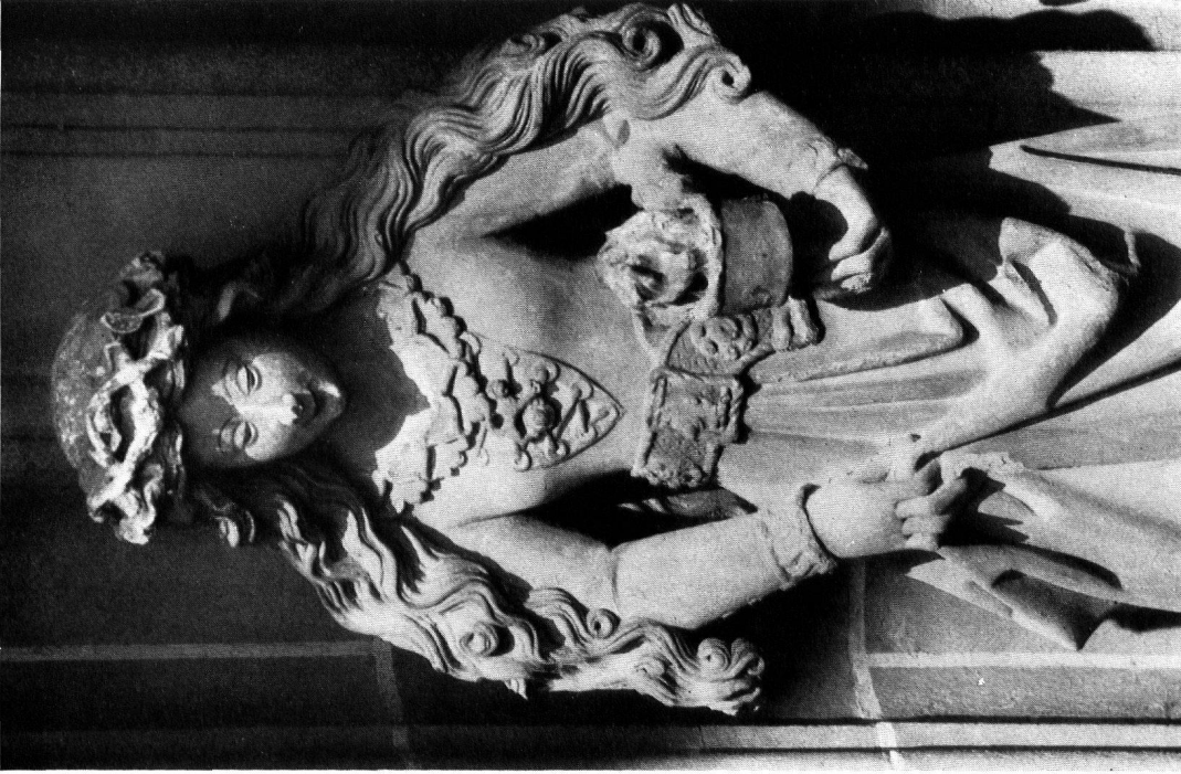
Abb. 1. ERHART KÜNG TÖRICHTE JUNGFRAU Bern. Münster, Westportal