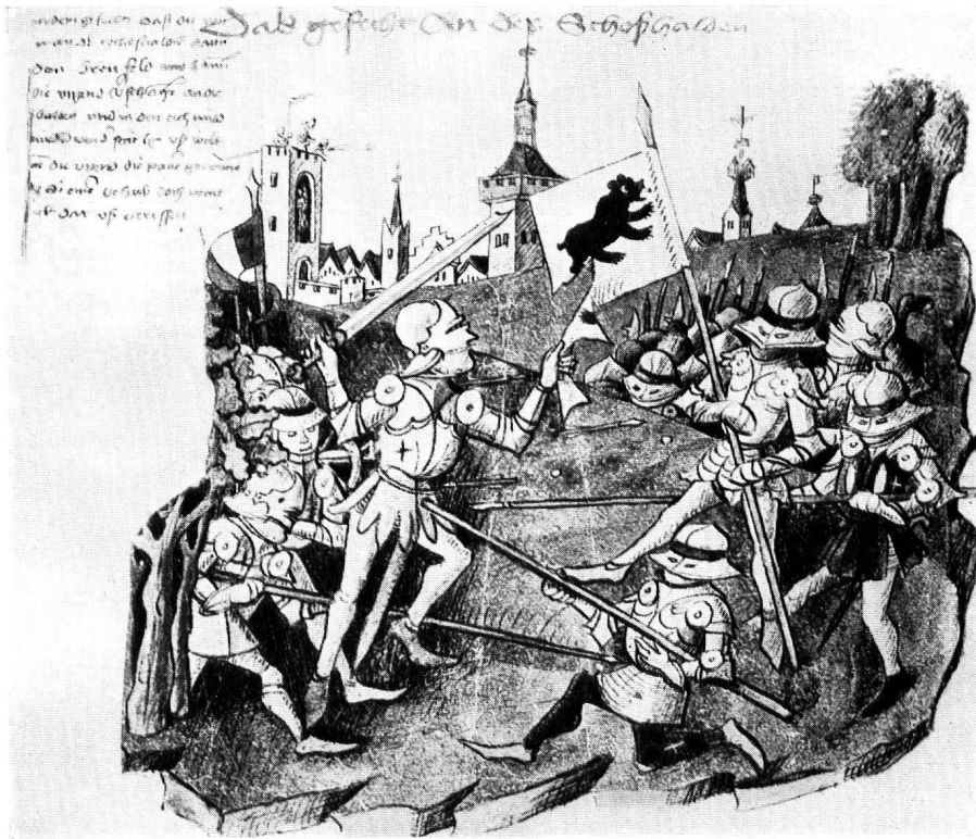
Abb. 6. GEFECHT AN DER SCHOSSHALDE Aus Tschachtlans Berner Chronik, 1470 — Zürich, Zentralbibliothek