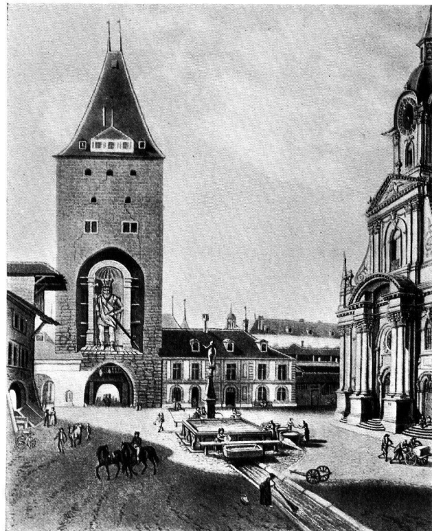
Abb. 6a. ALBRECHT VON NÜRNBERG CHRISTOFFEL AM BERNER OBERTOR Stich von Chr. Meichelt nach Zeichnung Lorys d. Ä., 1818.