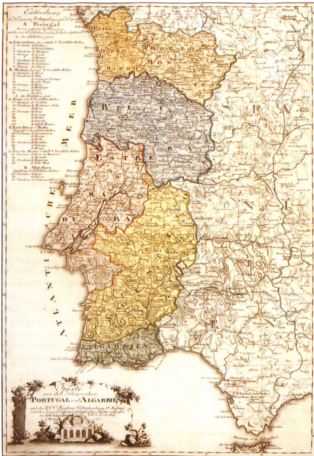
Abb. 2: Karte von Portugal und der Algarve von D.F. Sotzmann, 1791. Portugal befindet sich am Anfang der Ländereinteilung Ryhiners. Die Sammlung, die weltweit aufgebaut ist, besteht aus zerlegten Exemplaren der meisten wichtigen Atlanten, aus mehrblättrigen Kartenwerken sowie aus Karten-Einblattgedrucken und ist als Sammelatlas zu bezeichnen. (StUB, Ryh 1502:14).