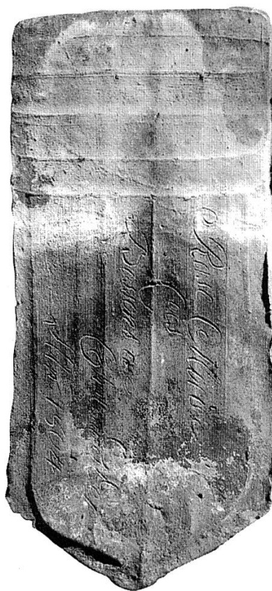
Fig. 5 Tuile produite à la tuilerie de Château-d'CEx portant l'inscription: «Rose Morier Cocs Bossons de Château d'CEx Lan 1804» échelle 1: 4 (MSVD no 323/11).

In seiner Erbauungszeit 1745 stach das Pfarrhaus von Château-d'CEx durch sein Ziegeldach aus allen holzgedeckten Häusern hervor. Dies war auch seine Rettung beim grossen Dorfbrand von 1800. Bei der Neueindeckung im Jahre 2000 konnten die Ziegel untersucht werden: