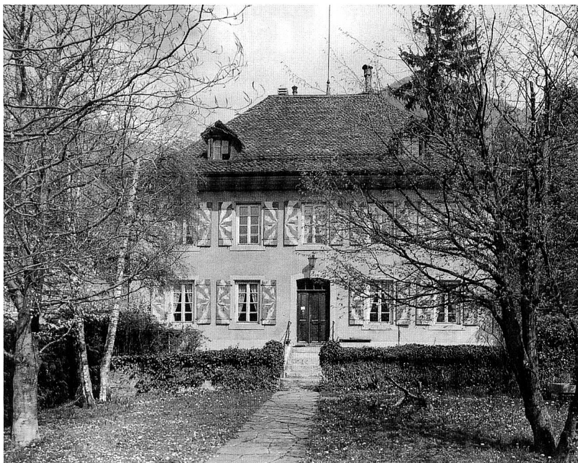
Fig. 1 Vue de la façade sud de la cure de Château-d'Œx. Etat en 1985 avant la restauration de la couverture.

la toiture notamment nécessitait des réparations importantes. Ainsi, en 1761, 6000 tuiles furent apportées depuis la Tour-de-Trême, près de Bulle, car il n'existait pas encore de tuilerie sur place. La différence de format entre les tuiles anciennes et les neuves ne semble pas être une raison suffisante pour expliquer l'écart très important entre le nombre de tuiles mentionné dans les commandes du XVIII e siècle et celles utilisées lors de la