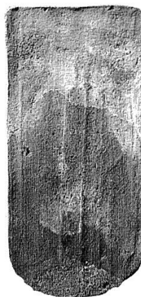
Fig. 6 Tuile à découpe arquée qui peut être située, par comparaison, au XIX e siècle (MSVD no 323/5).