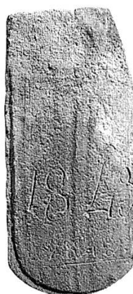
Fig. 7 Tuile datée 1843, à découpe arquée, provenant des anciennes prisons de Château-d'CEx (MSVD no 323/14).