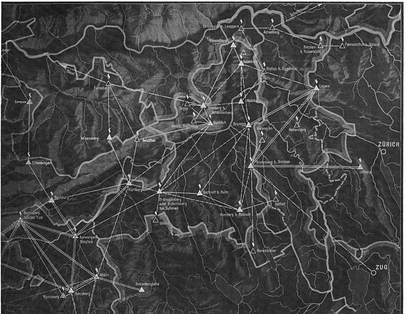
Karte der Hochwachten im 17.—18. Jahrhundert im Oberaargau und Bernischen Aargau und der Grenzkantone.

Beim Franzoseneinfall 1798 brannte die Hochwacht Wartburg zum letzten Male. Im Sonderbundskrieg war Solothurn nicht bei den Sonderbundskantonen. Eine Verbindung nach Luzern war darum nicht nötig. 1852 kam der elektrische Telegraph, die Hochwacht Wartburg-Säli kam in Abgang. Ein Rest davon war geblieben in der Alarmierung der Aarburger Feuerwehr durch Kanonenschüsse auf der Festung Aarburg. In meiner Jugendzeit war dies noch gebräuchlich; ich mag mich erinnern, dass ich die Schüsse recht gut hörte.