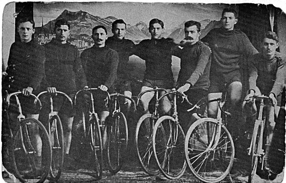
Rennfahrergruppe des VCA, anlässlich eines Mannschaftsfahrens in Baden 1920

Trotz den kiesgrubenartigen Strassen, überzogen mit dickem Staub oder Kot, wurde das Tourenfahren für Aktiv-Mitglieder, bei Busse von 50 Rp., als obligatorisch erklärt. Das Walzen der Strassen überliess man den Pferdefuhrwerken und Kutschen. Mit Ausnahme dieser Vehikel stand den Radfahrern die ganze Strasse zur Verfügung. Man nahm gerne Regen, Wind, Hitze und Kälte in Kauf. Die Ausfahrten wurden jeweils zu einem bleibenden Erlebnis, wenn man auch oft mit den unzuverlässigen Bremsen und Tücken der Karbidlaterne, oder mit einem Nagel im