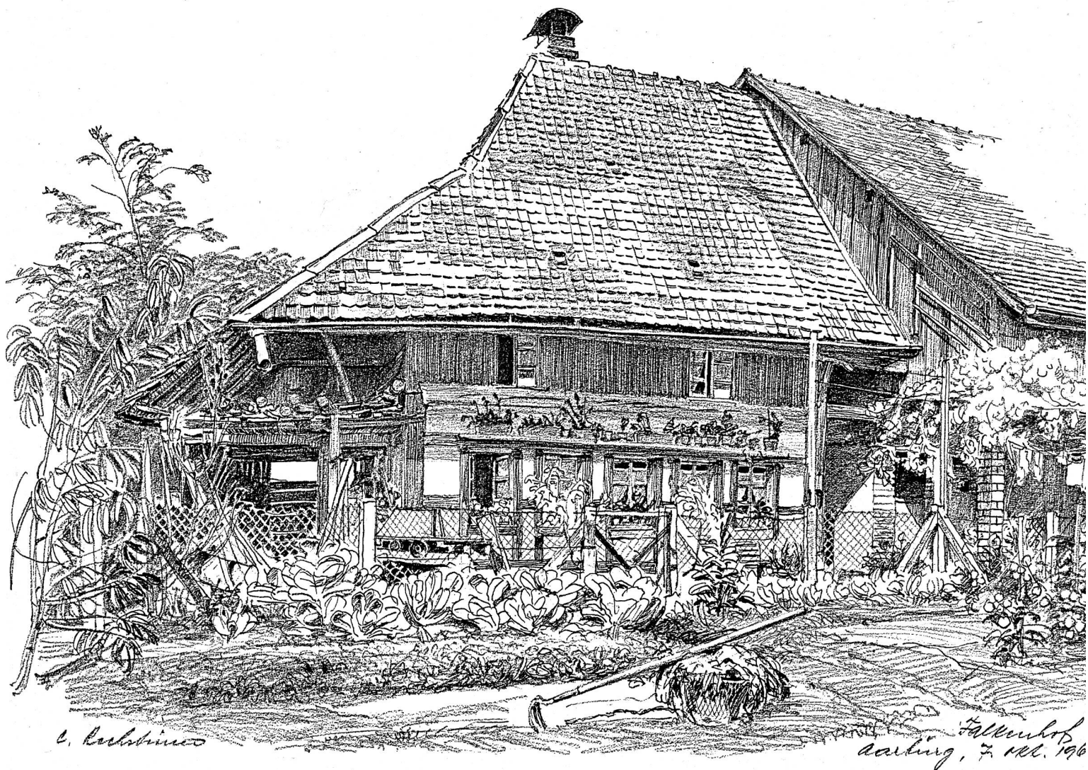
Der Falkenhof in Aarburg, 1964

Wir sind glücklich, hier drei seiner Zeichnungen zeigen zu können.