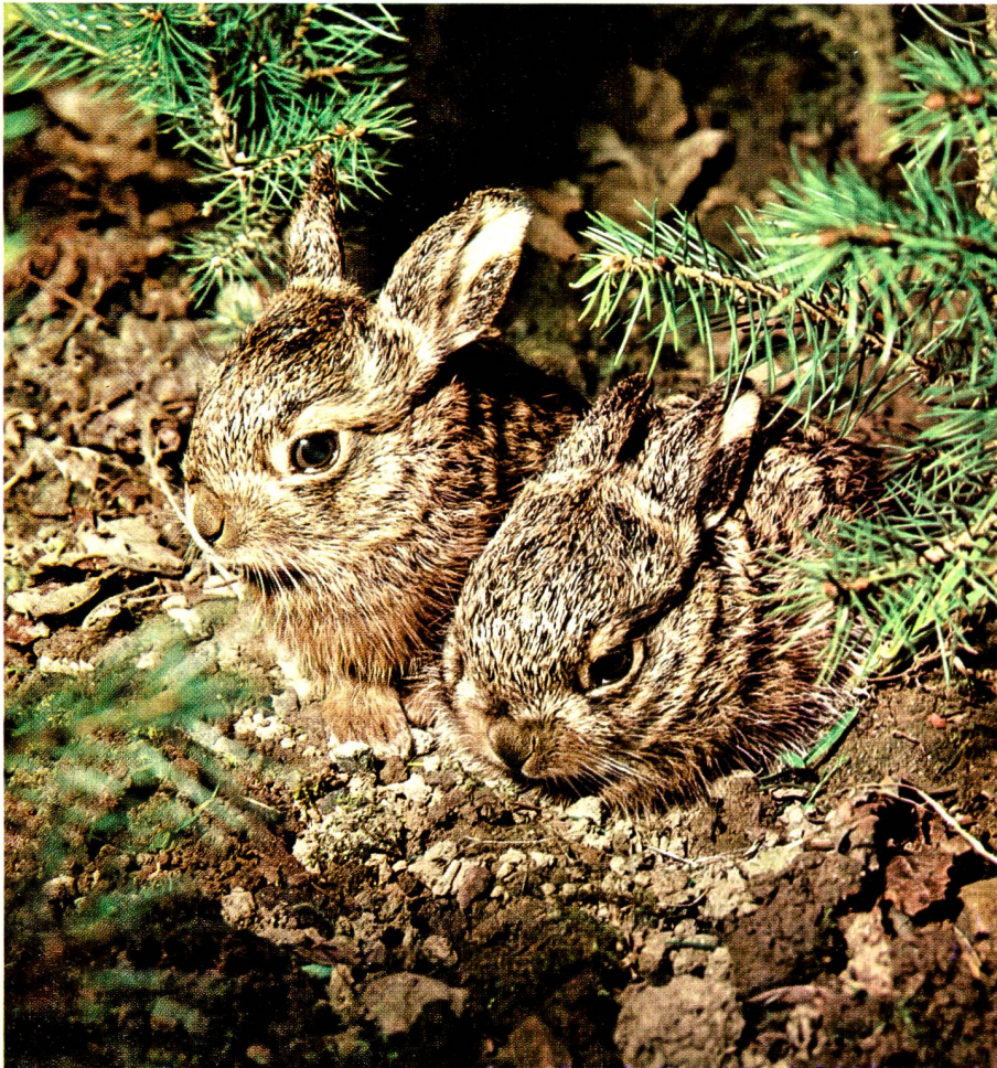
🏠 Junge Waldhasen