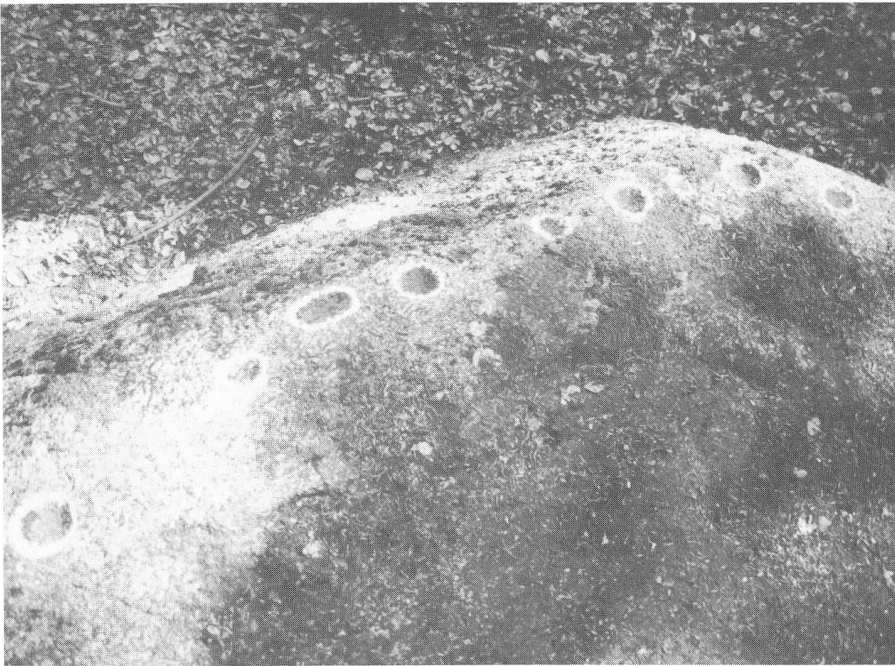
Abb. 3: Schalenstein im Martinswald von Rüttenen So

Von zahlreichen Schalensteinen, die sich um Solothurn befinden, ist besonders der Stein von Rüttenen zu erwähnen. Er liegt im Martinsfluhwald.