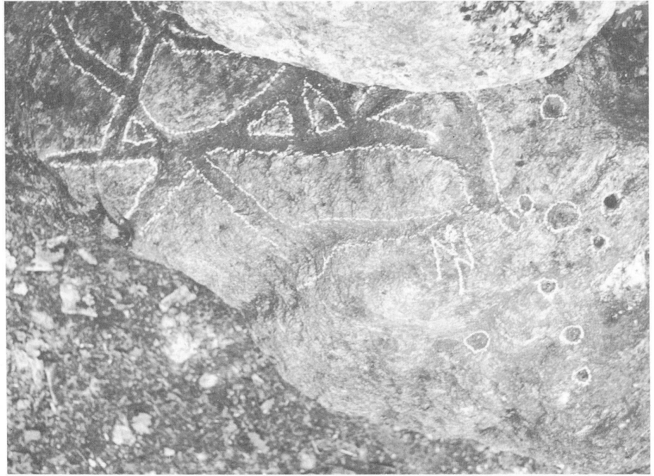
Abb. 2: Schalenstein von Oensingen mit undeutbaren Rillen (mit Kreide nachgezogen).

Das Schalenbild weist 8 Näpfchen auf von ca. 4 cm Durchmesser und 1–2 cm Tiefe. Was aber besonders interessant ist, das ist ein Netz von breiten Rillen, die sich unregelmässig auf eine Fläche von 50 auf 25 cm verteilen. Dieser Stein mit seinen Rinnen ist nicht deutbar. Abb. 3