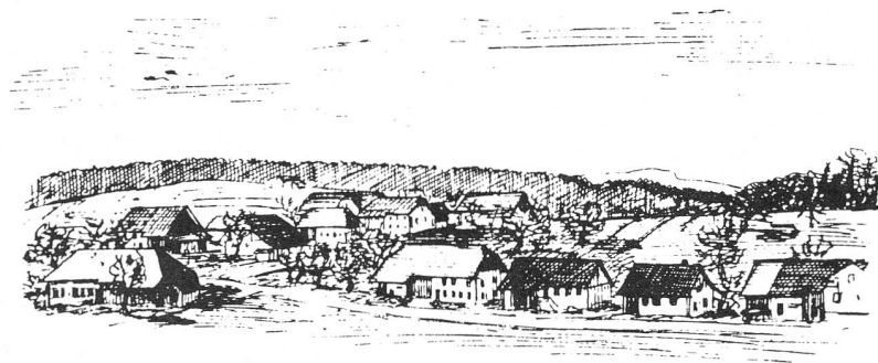
Rüthhof bei Gränichen

Humanität am rechten Orte angewandt, ist eine schöne Sache, am unrechten Orte und bei verworfenen unverbesserlichen, das ganze Land beunruhigenden Schelmen in Anwendung gebracht — bedeutet sie Schwäche . . .»