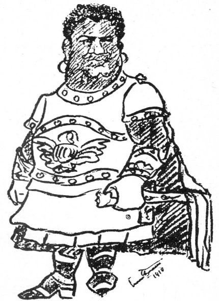
Caruso als Radames in «Aida». Gezeichnet von Caruso um 1910.

grossen Durchbruch der Schallplatte in weiteste Kreise. Die berühmte «Mattinata» von Leoncavallo ist wahrscheinlich das