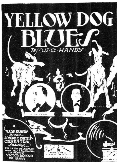
Eine der ersten Anzeigen für Jazzplatten um 1917.

erste Stück, das extra für eine Plattenfirma komponiert wurde. Dadurch gelangte es rasch zu grosser Popularität und gehört noch heute zum Standardreertoire eines jeden Tenors.