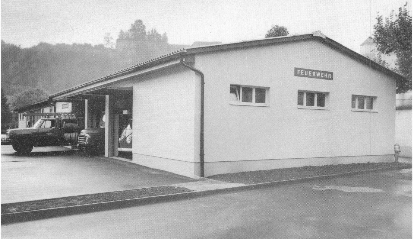
Das 1965 als Provisorium erstellte Feuerwehrdepot wurde 1968 ausgebaut und 1976 erweitert.

Wenn man die heutige Feuerwehr zu einer Brandbekämpfung oder irgendeiner Dienstleistung anfordert, so geschieht dies ganz selbstverständlich über Telefon Nr. 18 oder 41 11 18. Nach wenigen Minuten ist eine sehr einsatzfähige Mannschaft am Schadenort und bringt genügend Material mit. Wie sah es aber aus, bevor das Pikett der Feuerwehr Aarburg gegründet wurde? Gewiss gaben sich auch die einstigen Feuerwehrleute ebensoviel Mühe, rasch auf dem Brandplatz zu sein, aber die Alarmierung und auch das Material sahen ganz anders aus. Ein Blick in die Protokolle der «guten alten Zeit» bringt allerhand Kurioses zum Vorschein.