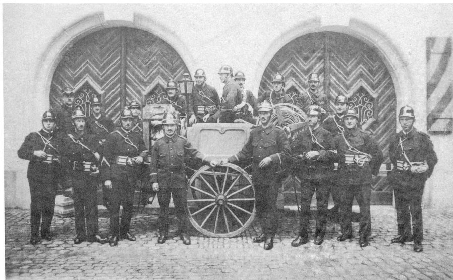
oben: Das neu gegründete Pikett Aarburg mit dem neuen Pikettwagen vor dem Geräte-lokal im Winkel.

Mit der Vergrößerung der Gemeinde und den diversen Industrien, kamen auch für die Feuerwehr neue Probleme. 1965 konnte ein Allradfahrzeug (Austin) mit Seilwinde, ein 250 kg Staublöschanhänger, 1968 eine 22 m Stahlleiter, 1967 ein VW für die Verkehrsgruppe, 1973 ein Tanklöschfahrzeug, im Inventar vermerkt werden. Sehr gewandelt hat sich auch die persönliche Ausrüstung. Bei der Pikettgründung musste sich die Mannschaft mit Rock und Lederhelm begnügen. Rettungsseile standen nur den ausgebildeten Rohrführern zur Verfügung.