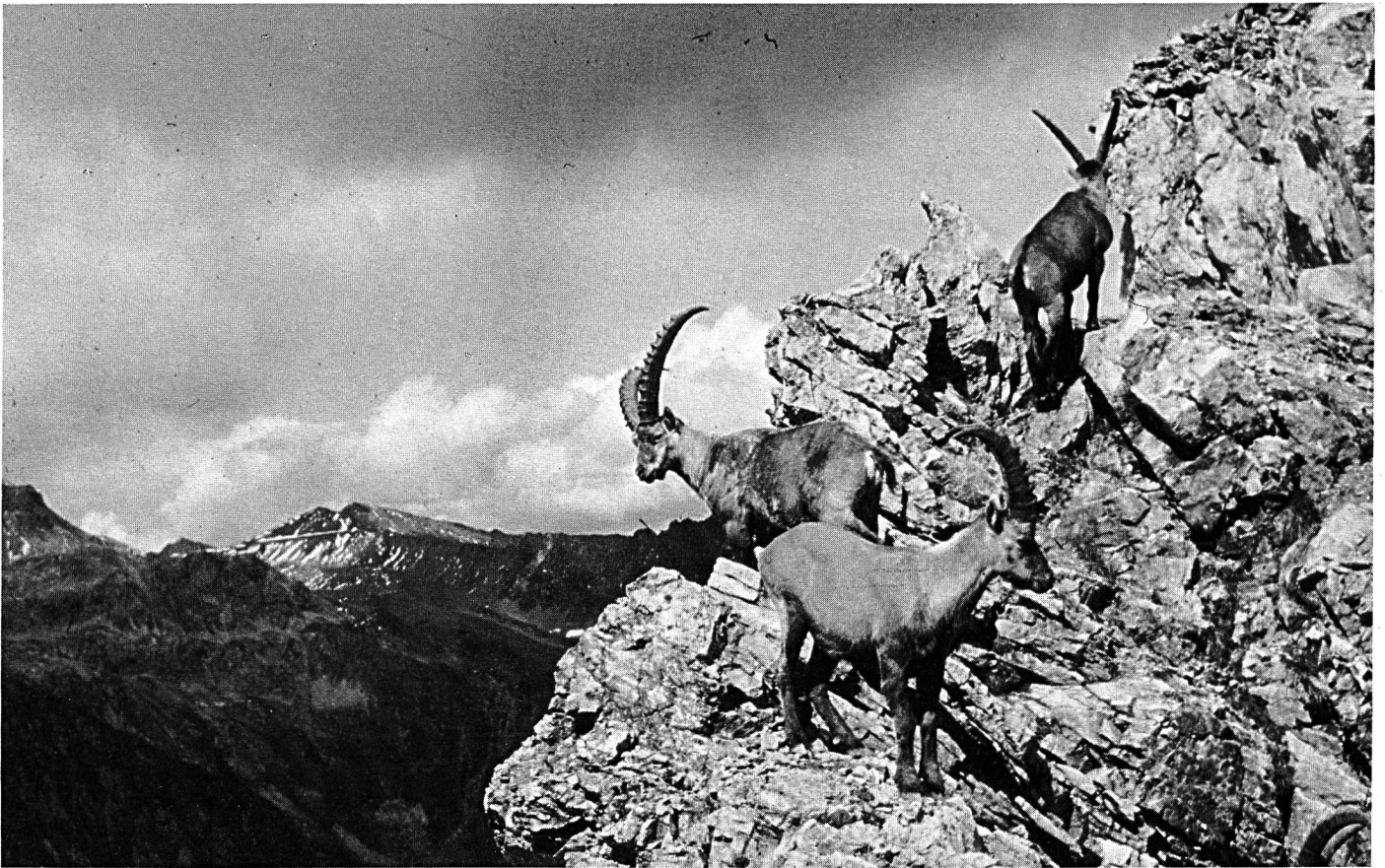
Der Alpensteinbock — in seinem kargen Lebensraum in den Bergen.

Starke Steinböcke können ein Gewicht von 80—140 kg erreichen und ein Alter bis zu 20 Jahren. 1911 wurde im Weisstannental SG das erste Steinwild wieder angesiedelt, nachdem es im letzten Jahrhundert ausgerottet wurde. 1980 sind es in der Schweiz bereits wieder einige tausend Stück. Zur Gesundheit des Steinwildes und zum Schutz des Bergwaldes erfolgt wieder eine gezielte Bejagung.