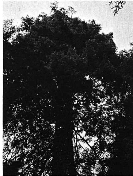
Baumkrone einer 300jährigen Tanne im Plen- terwald. Stamminhalt ca. 30 m 3 .