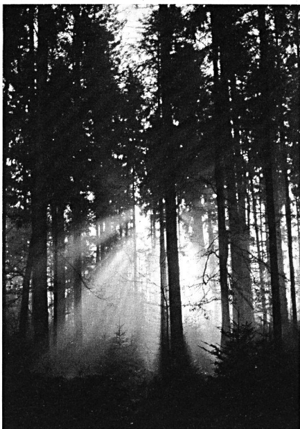
Nebelstimmung im Fichtenwald. 100jähriger Fichtenwald mit üppigem Anflug von Natur- verjüngung.

Der natürliche und saubere Bergbach erfreut ► jeden Spaziergänger.