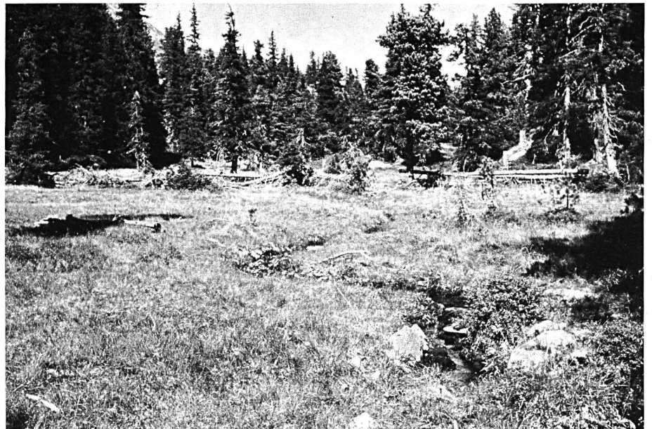
Fichten-Bergföhrenmoor im alpinen Fichtenwald.