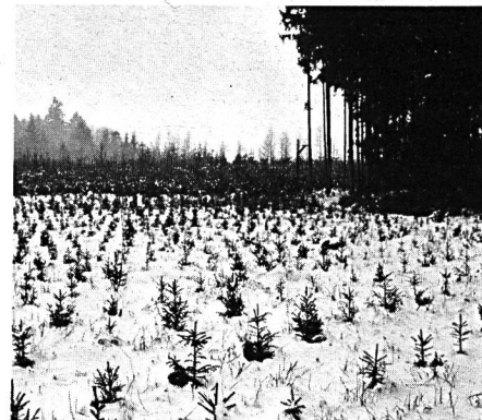
Kahlschlag des Fichtenwaldes im Mittelland, mit erneuter Fichtenpflanzung — ein wirtschaftlicher und ökologischer Unfug, der mit natürlichem Waldbau nichts zu tun hat. Das gute Gegenstück ist der natürliche Plenterwald oder der feine Femelschlagwald.

müssen gesucht werden. Nur den Weg dazu versuchte ich aufzuzeigen. Ich habe Ihnen — sehr geehrte Herren — ein paar Gedanken zum Thema Jagd und Naturschutz zu vermitteln versucht. Die beiden Begriffe können heute identisch sein, wenn der Jäger die ihm von der Natur auferlegte Aufgabe treuhänderisch erfüllt. Nur darob habe ich nicht schon längst Büchse und Flinte an die Wand gehängt, um zu resignieren. Jagd als Naturschutz erfüllt und bereichert. Sie öffnet neue und vor allem lohnendere Wege zur intensiven Begegnung mit dem wunderbaren Begriff Natur voller Geheimnisse und Gesetzmässigkeiten. Jagd als Naturschutz ist notwendig, verantwortlich und zeitlos. Jagd als reines Vergnügen und Trophäenkult überholt und museumsreif.