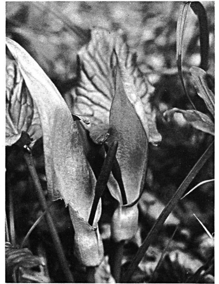
Der Aronstab — eine unscheinbare wunderschöne Pflanze.