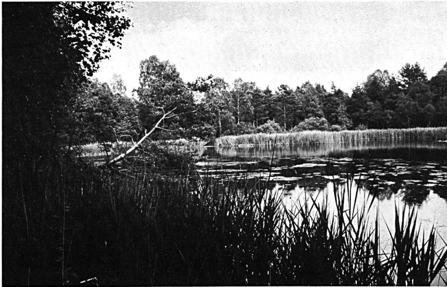
Mooresee im Riet — eine wichtige Ökonische für Pflanzen und Tiere.