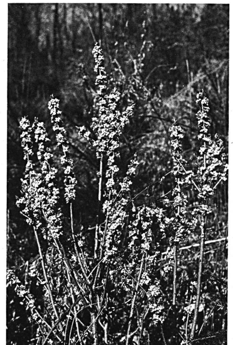
Rechts unten: Wenn der Seidelbast im Frühjahr wieder blüht, beginnt das neue Leben im Wald.