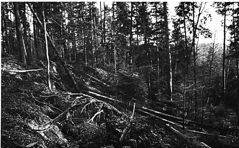
Erdbeben im Waldtobel. Dank dem Wald erfolgte die Erdbewegung nur auf begrenzter Fläche. Ohne Verbauung, nur durch den natürlichen Anflug des Waldes ist dieses Rutschgebiet weitgehend wieder stabilisiert.

sie zu Beginn des Jahrhunderts sicher notwendig waren. Für einzelne Wildarten andererseits waren damals die Umweltbedingungen noch weit weniger tangiert und sie daher weit reichlicher vorhanden als heute. Ich denke etwa an Ur- und Haselhuhn. Im Zusammenhang mit dem wirklichen Schutz des Biotops Wald steht eng die regulatorische Funktion des Jägers. Er muss sich im Klaren sein, dass dieser Wald seine Funktionen nur dann richtig erfüllen kann, wenn zur standortgerechten Betreuung durch den modernen Forstmann auch der standortgegebene Wildbestand kommt. Wobei weniger die Stückzahl auf hundert Hektar Wald ausschlag-