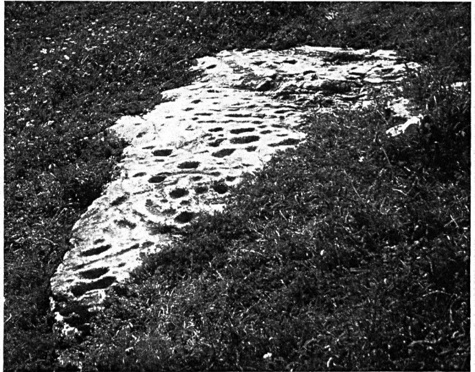
Abb. 1 Der Schalenstein von Ardez, ein vorgeschichtlicher Kultstein (Gesamtansicht). Die einheimische Bevölkerung nennt ihn Hexenplatte.

(z.T. nach Caminada: „Die verzauberten Täler – Kulte und Bräuche im alten Rätien“.)