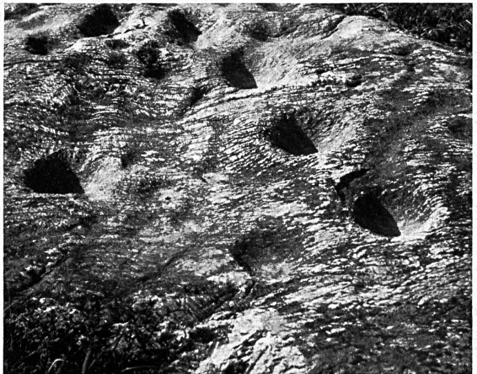
Abb. 2 Schalenstein von Ardez (Teilansicht). In den gegen 20 kleinern und grössern Schalen brannten zur Zeit des Frühlingsbeginns Harz- und Butterlichter.