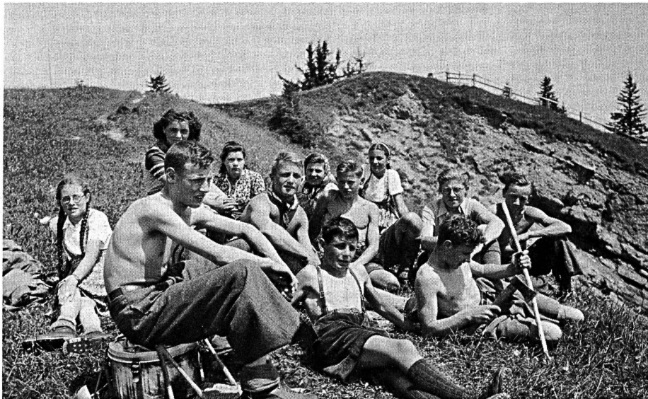
Schulreise 1942 (Jahrgang 1927).