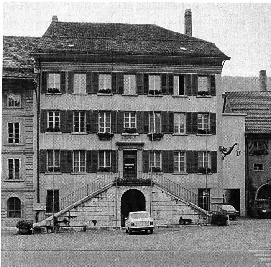
Rathaus. Hier war die Bezirksschule von 1836 bis 1962 untergebracht.