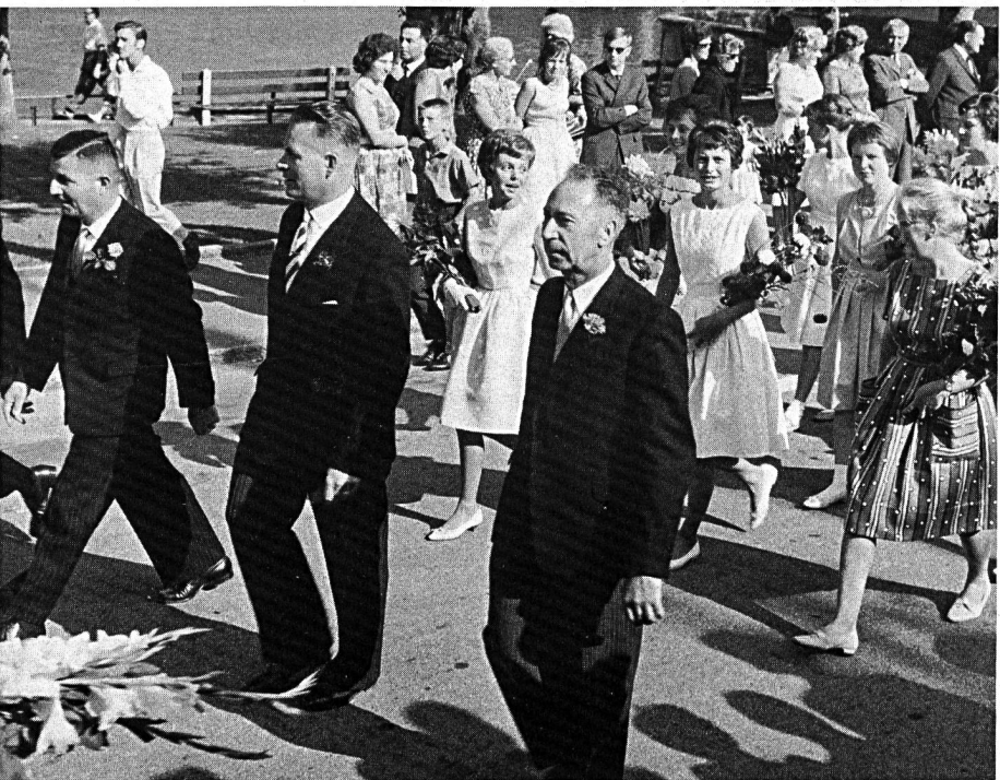
Die 3 «B», Jugendfest 1962.

erwies, wenn in personeller Hinsicht eine Verbindung zu den politischen und kirchlichen Behörden bestand. — Die Aufsicht im Auftrag des Kantons ist Sache der Bezirksschulinspektoren. In den vergangenen 150 Jahren waren es insgesamt 35 Persönlichkeiten, die die Leistungen unserer Schule zu beurteilen hatten. Der grösste Teil dieser Respektspersonen waren Mittelschullehrer oder geistliche Herren beider Konfessionen; das restliche Drittel bildeten Gerichtsherren, Direktionssekretäre und sogar ein akademisch geschulter Bierbrauer! Dabei darf man feststellen, dass diese letztere Gruppe sich in ihren Beurteilungen kaum weniger kompetent zeigte als ihre auf pädagogischem Gebiet tätigen Kollegen.