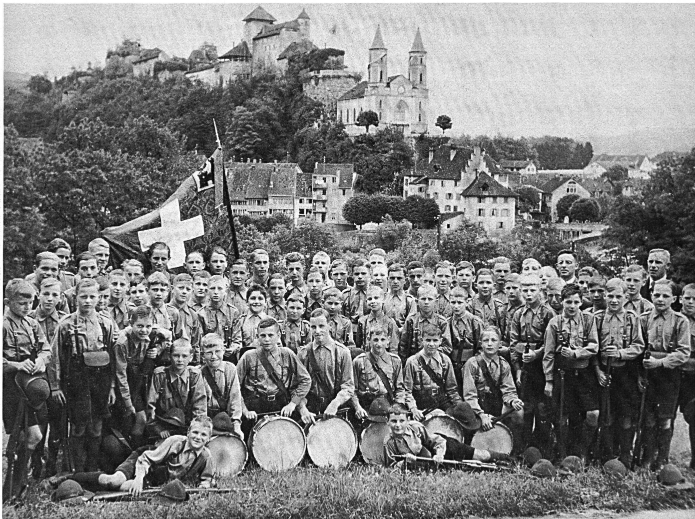
Kadettenkorps, ca. 1939.

in vorgerückten Jahren mit der Ehrendoktorwürde ausgezeichnet.