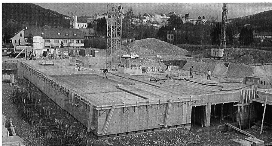
Deckenschalung über Untergeschoss.

projektierenden Architekten hatten zusammen mit einer Arbeitsgruppe eine Sparvariante ausgearbeitet, die zweckmässig war und nur die aller-notwendigsten Räume umfasste: Dringend notwendige Schulräume für den lehrplanmässigen Unterricht, geeignete Räume für die Kultur- und Sportvereine, eine Truppenunterkunft mit Nebenräumen (siehe Bericht BAMF). Eine gut-gelaunte Gemeindeversammlung stimmte am 5. Dezember 1991 dem überzeugenden Projekt mit einem Bruttokredit von 10,9 Millionen Franken einhellig zu.