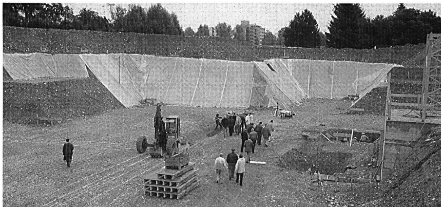
Beginn der Baumeisterarbeiten.

1988 hatte der Gemeinderat auf Ersuchen der Schulpflege die Schulraumfrage wieder aufgenommen. Mit einer umfassenden Abklärung wurden auch die Bedürfnisse der Kultur- und Sportvereine, des Zivilschutzes und der Gemeinde allgemein miteinbezogen. Im Herbst 1989 bewilligte der Einwohnerrat