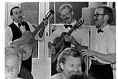
Los chicos perfidos sorgen für Unterhaltung in den Beizlis.