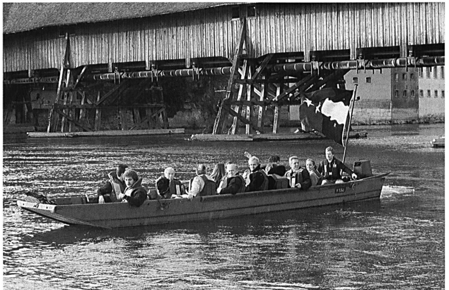
Per Boot wird Olten verlassen.