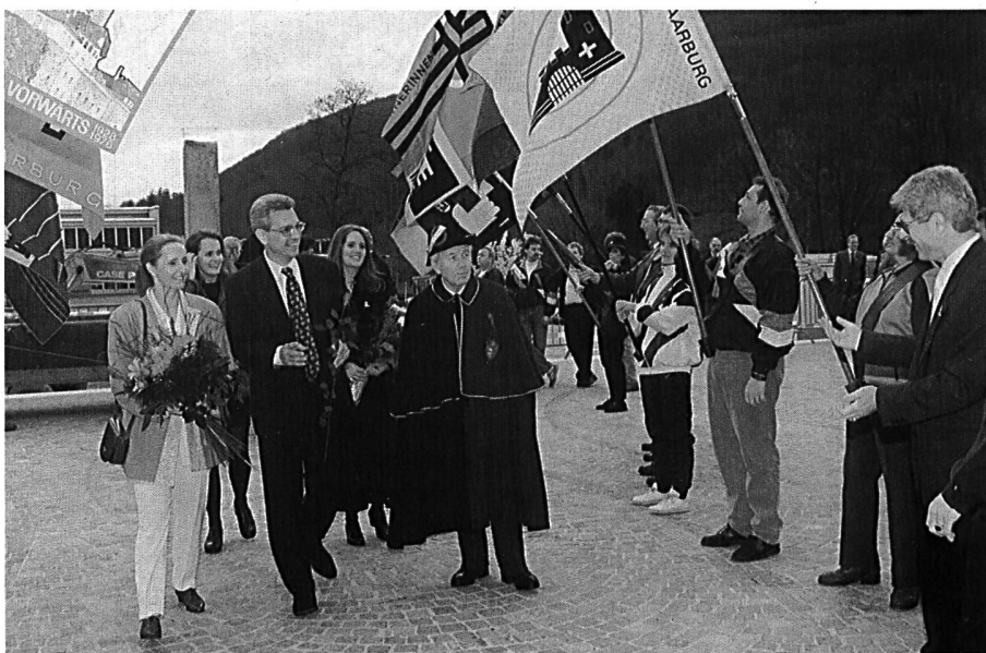
Grossartiger Empfang durch Fahndelgationen der Aarburger Vereine vor der neuen Mehrzweckanlage Paradiesli.