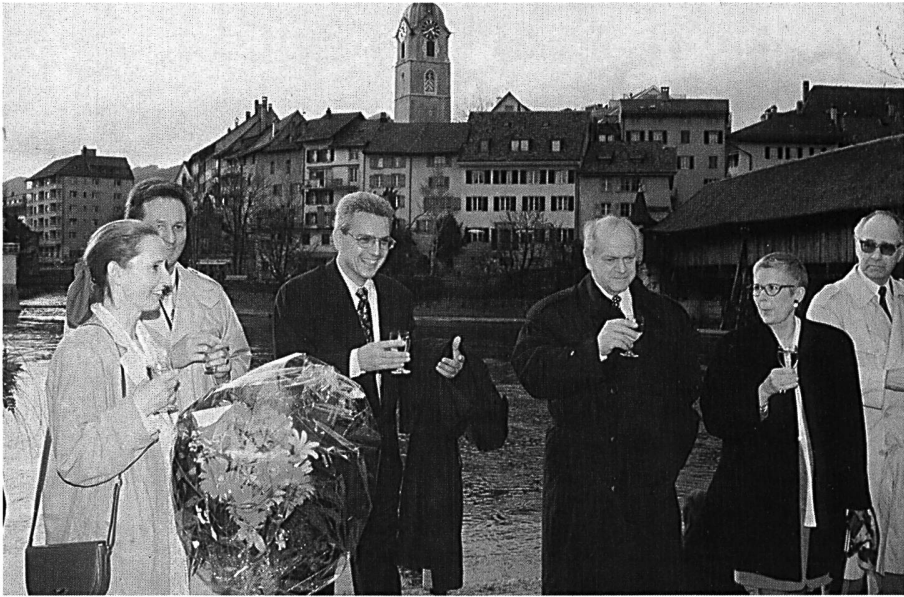
Der Stadtrat von Olten begrüsst die Gäste mit einem Apéro vor der imposanten Altstadtkulisse.