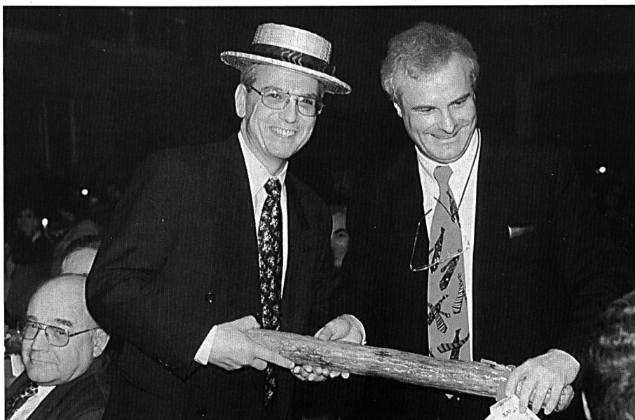
Landammann Ulrich Siegrist bei der Übergabe eines symbolischen Geschenkes.