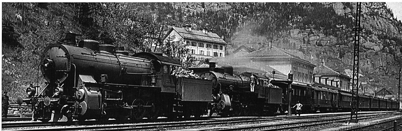
Um 1910, ein Jahr nach der Verstaatlichung der Gotthardbahn, erreicht die Dampftraktion auf der Gotthardlinie ihren absoluten Höhepunkt. Eine A 3/5 Schnellzuglokomotive führt den schweren Express, eine C 4/5 Güterzuglokomotive leistet ab Erstfeld Vorspann; beide noch von der Gotthardbahn beschafften Lokomotiven waren damals die modernsten und stärksten Maschinen auf der Bergstrecke. Der Betriebshalt in Göschenen betrug in jenen Jahren noch gut 25 Minuten, wovon das Bahnhof-Buffet Göschenen mit seinem berühmt gewordenen Perron-Service (heisse Suppe, Brot und Würstchen) jahrzehntelang profitierte.

Wie weitsichtig der Entscheid war, zeigte sich bald nach der Eröffnung der Gotthardbahn, wo im ersten vollen Betriebsjahr 1,065 Millionen Passagiere befördert wurden. Die unerwartet rasche und volumemässig starke Verkehrszunahme machte neben der Beschaffung von leistungsfähigerem und komfortab-