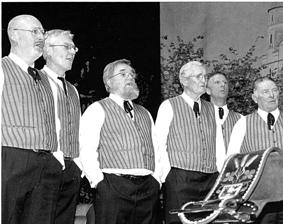
Alle sind mit grösster Konzentration dabei.