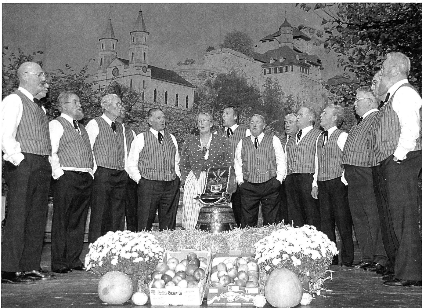
Der Jodlerclub am Jubiläumsabend vor dem imposanten Bühnenbild.