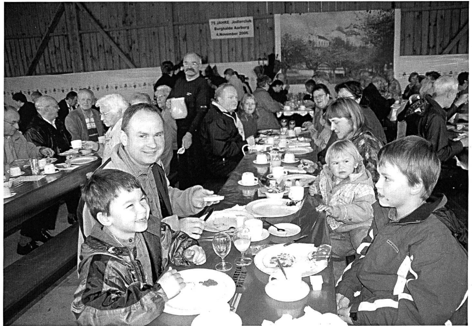
Immer gut besucht: Das traditionelle Jodlerzmore.

Das 50-jährige Bestehen des Jodlerklubs Burghalde wurde im Jahre 1981 würdig gefeiert. Als Höhepunkt durfte der Bevölkerung die neue Tracht präsentiert werden, die Aargauer Sonntagstracht und die Jodlerbluse.