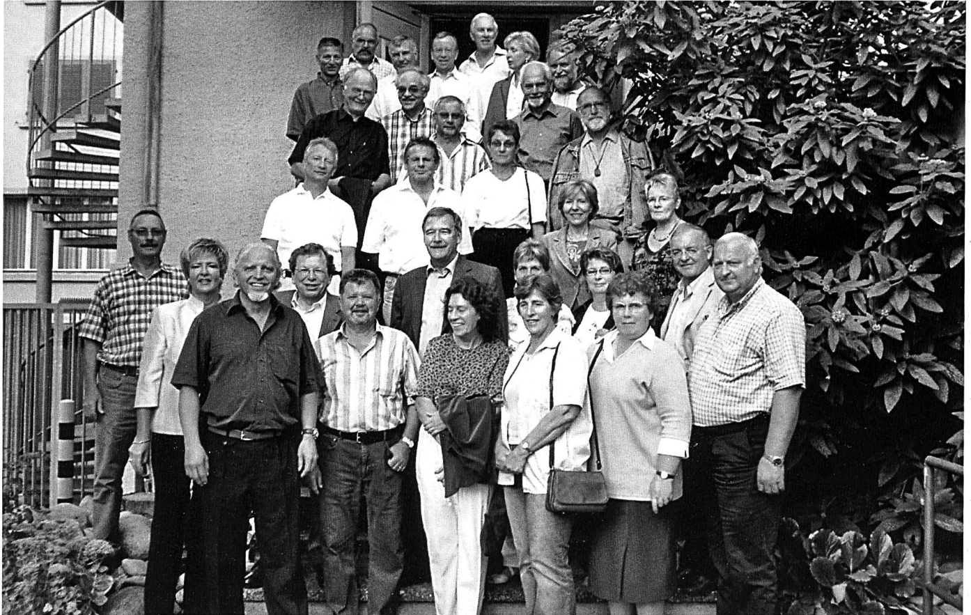
Die Teilnehmer am Jahrgängertreffen 2006 hinter dem Hotel Krone.

Es ist nicht nur in Aarburg, sondern vielerorts, Tradition, dass sich Jahrgänger und/oder ehemalige Schulkameradinnen und -kameraden in verschiedenen zeitlichen Abständen am ehemaligen Schul-/Wohnort treffen. Ein guter Grund, im Neujahrsblatt eine kleine Dokumentation mit Fotos aus vergangenen Zeiten zu präsentieren. Eingeladen sind Jahrgänge die ein rundes Treffen, ab 60 Jahren, feiern.