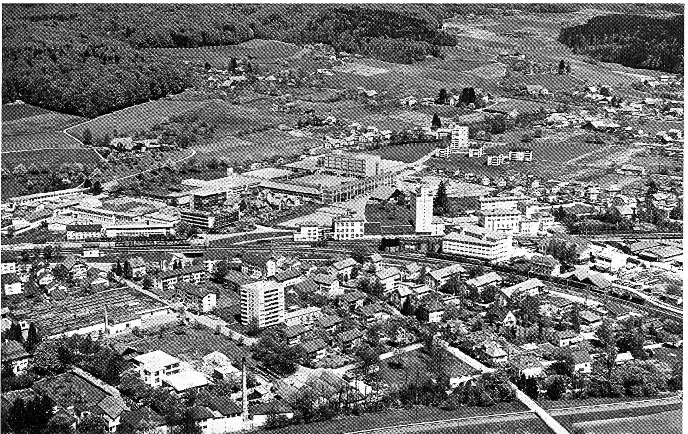
So sah das Gebiet des Bahnhofs im Jahr 1962 aus.

Die 1942 provisorisch erstellte sogenannte «Kriegsschlaufe» wurde im Jahre 2006 ausgebaut und macht heute eine attraktive und schnelle Verbindung von Luzern über Zofingen nach Bern möglich.