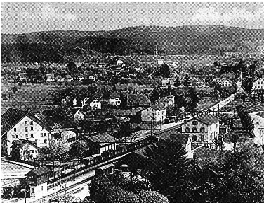
Bahnhof Aarburg im Jahr 1934 mit Blick Richtung Oftringen.

Zielbewusster als der Aargau in der Verfolgung der Eisenbahnpolitik, zeigte sich der Nachbarkanton Solothurn. Die beiden Städte Solothurn und Olten erkannten frühzeitig die verkehrs- und wirtschaftspolitische Bedeutung der Eisenbahn. So offerierte Olten die unentgeltliche Abtretung des für die Bahnanlagen und die Werkstätten erforderlichen Areals.