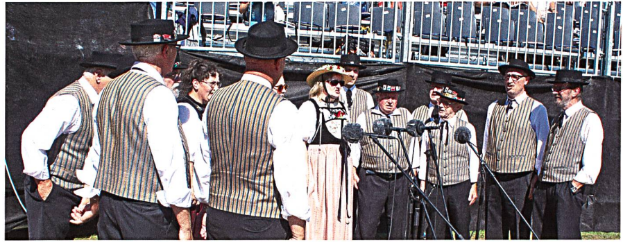
Darf an einem Schwingfest nicht fehlen: Jodelgesang. Am Sonntag war der einheimische Jodlerklub Burghalde im Einsatz

Nach dem Wettkampfbeginn startete auch das volkstümliche Rahmenprogramm hier. Hier setzte Moritz Hunziker als Verantwortlicher auf einheimische – und passend zu den Wettkämpfern – auf junge Interpreten. So traten der Jodlerklub Burghalde, Aarburg, das Swiss-Alphorn Jugendtrio, Aarburg, die Jungtambouren Rothrist/Zofingen, junge Fahnenschwinger aus der Region sowie das Schwyzerörgeli-Quartett Schenkenberg rund um die Schwingplätze auf. Die Big-Band der Stadtmusik Aarburg umrahmte zudem den Festakt und das Rangverlesen.