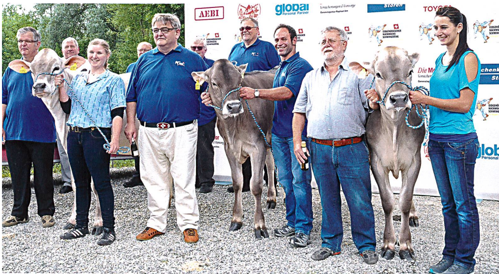
Lebendpreistaufe am 13. Juni 2015