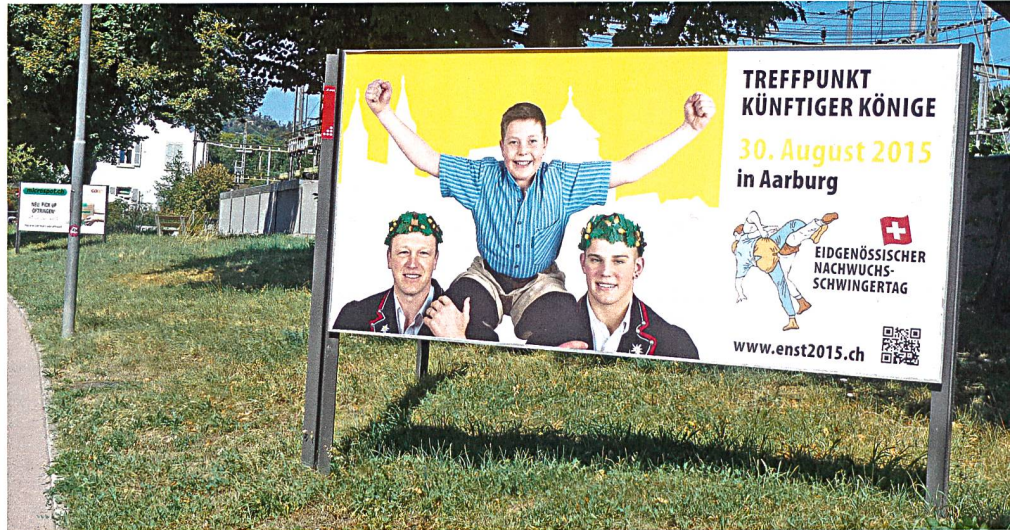
Werbepaket beim Bahnhof Aarburg