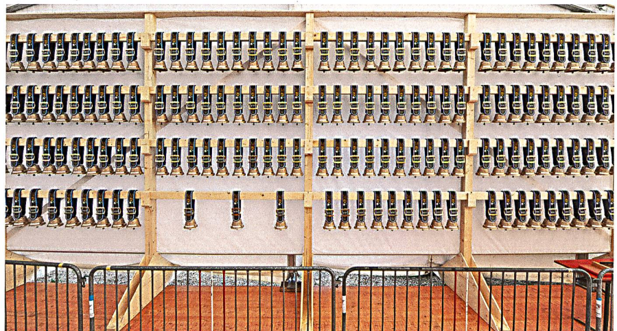
Jeder Teilnehmer durfte als Ehrengabe eine Glocke mit nach Hause nehmen