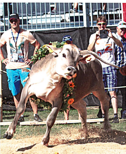
Ein Lebendpreis auf Abwegen