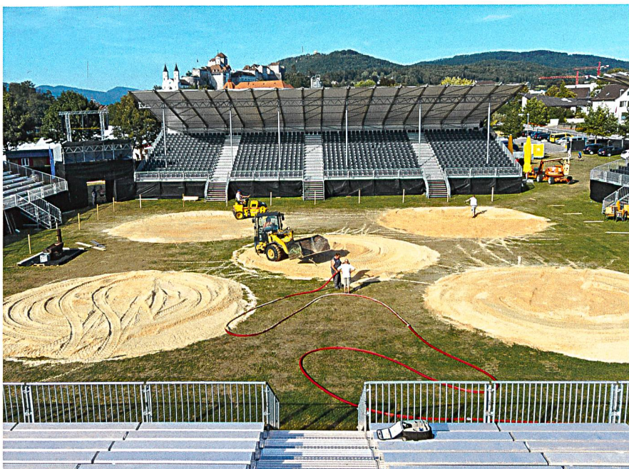
Der Schwingplatz nimmt Formen an