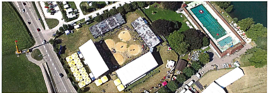
Das Fest aus der Vogelperspektive

Selbstverständlich wurde auch für das leibliche Wohl bestens gesorgt. Zahlreiche Verpflegungsstände lockten mit einem abwechslungsreichen Angebot. Einen guten Umsatz machten an diesem heissen Tag sicher auch die beiden Glacéstandbetreiber. Im Festzelt ging insbesondere über Mittag die Post ab. Rund achthundert Bankettgäste wurden innerhalb von gut einer Stunde mit einem feinen Dreigangmenü verwöhnt. Auch der Rest des Festzelts war sehr gut gefüllt, so dass das Servierpersonal pausenlos im Einsatz war.