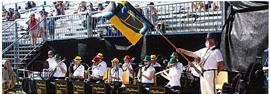
Die Big-Band Stadtmusik Aarburg umrahmte den Festakt musikalisch.

Nach und nach füllten sich die Tribünen (3 x 1052 Sitzplätze und 1 x 976 Sitzplätze), so dass eindruckliche Bilder der grossartigen Kulisse entstanden.