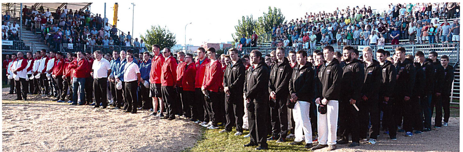
Einmarsch der Wettkämpfer am Sonntagmorgen, Singen der Nationalhymne

Als herrlicher und heisser Tag erwies sich auch der Sonntag, der eigentliche Höhepunkt. Dieser begann eindrücklich mit dem Einmarsch der fünf Teilverbände und dem Singen der Nationalhymne.