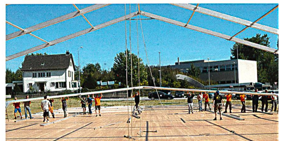
Zeltaufbau mit vereinten Kräften