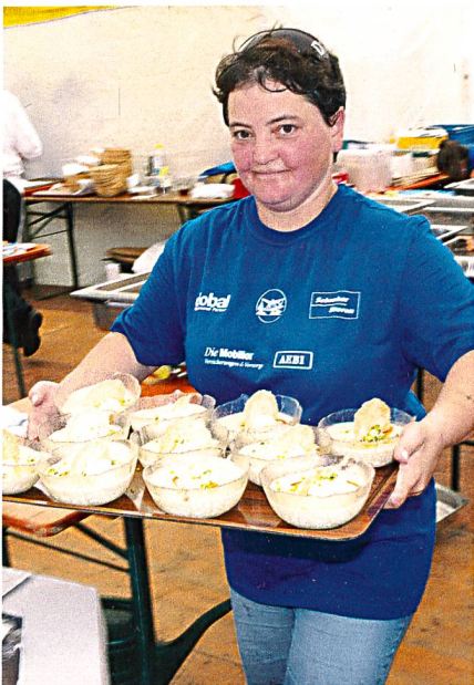
Die Helferinnen und Helfer leisteten grossen Einsatz