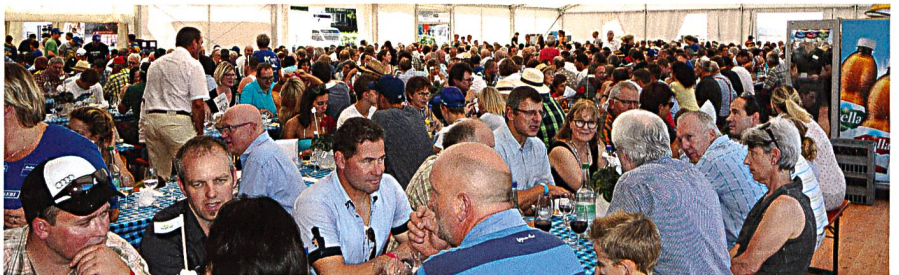
Volles Haus beim Mittagessen