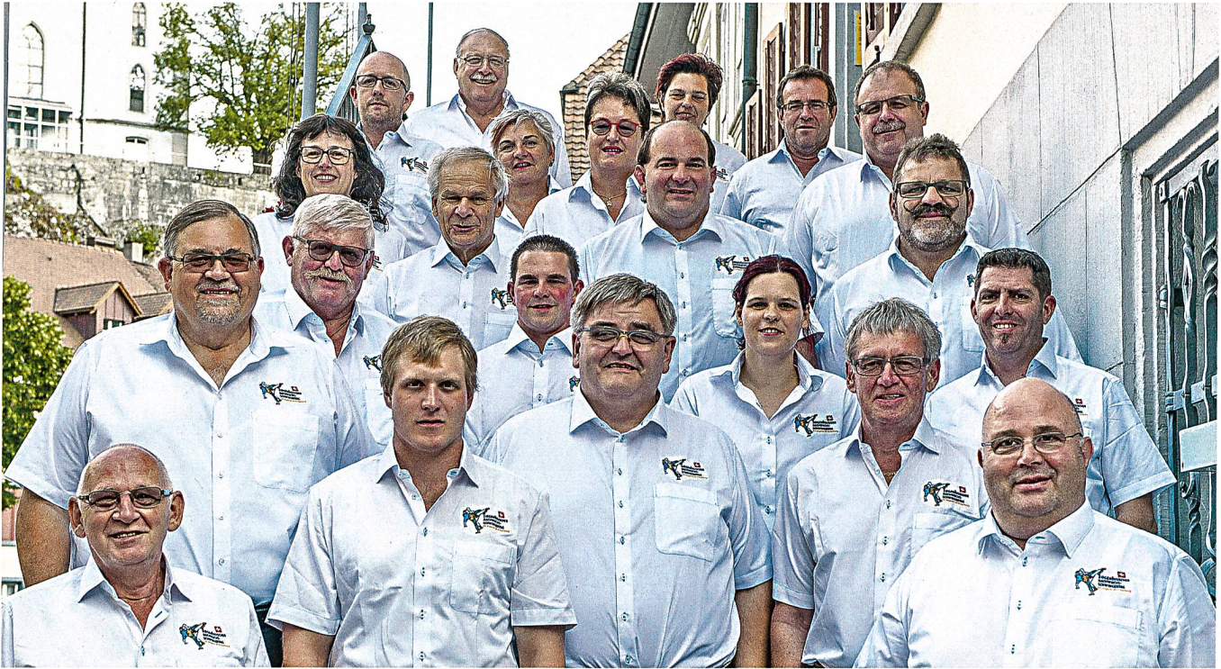
Ein Grossteil des OK auf der Rathaustreppe in Aarburg

Im Verlauf des Sommers 2013 entschieden sich einige Mitglieder das OK zu verlassen. Es kam daher zu einem grösseren personellen Umbau.