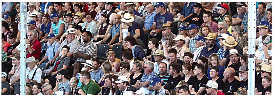
Das rege Interesse sorgte für gut gefüllte Tribünen