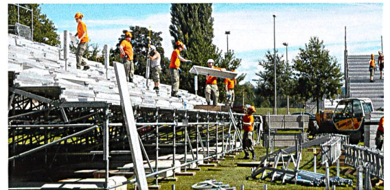
Die Zivilschützer der Zivilschutzorganisation Wartburg zeigten grossen Einsatz und waren der Erfolgsfaktor beim Tribünenaufbau