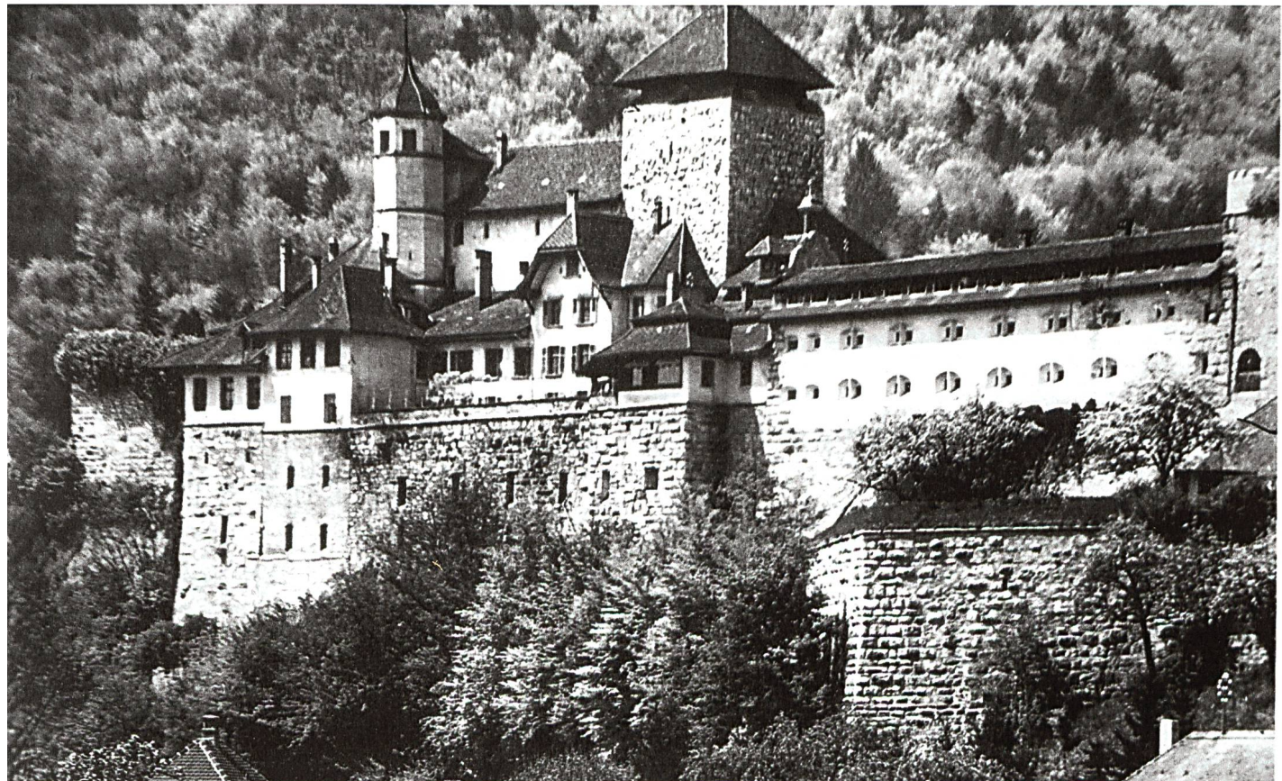
Festung Aarburg, Kasernentrakt nach Einbau der Mansarden im Dachgeschoss 1917

Auch die geplanten Unterführungen an der Bahnhofstrasse in Aarburg sowie die Überführung der Kreuzstrasse in Oftringen wurden von den Baubehörden der SBB abgewiesen und der Posten von Fr. 300'000 aus dem Budget gestrichen. Zu den ... vernachlässigten Stationen gehört auch die unsrige. ... Wie lange wird man sich dieses Spielchen noch gefallen lassen müssen? (2)