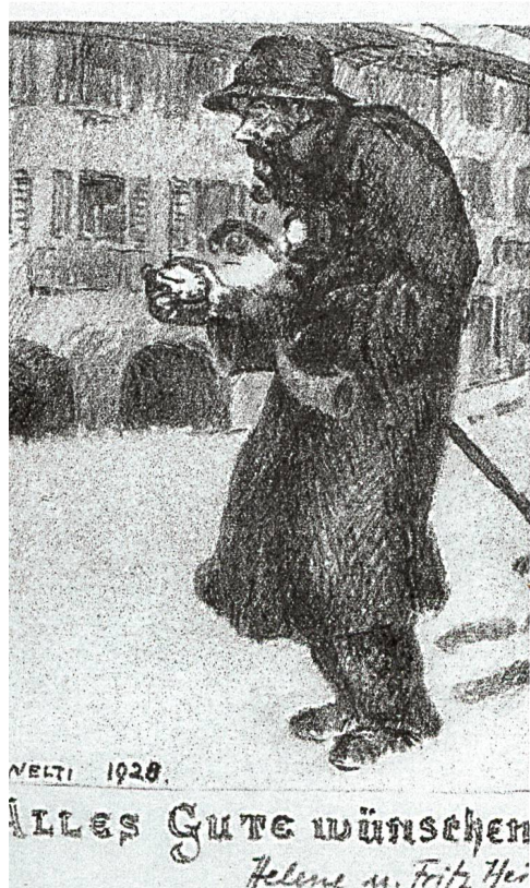
Nachtwächter Reinli gezeichnet von Charles Welti