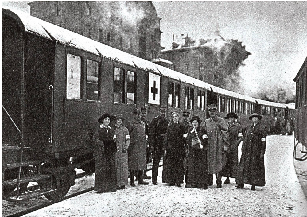
Personal und Zug eines Verwundetentransportes.