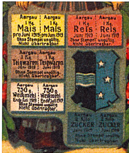
Lebensmittelkarte aus dem Ersten Weltkrieg (aus: Heimatkunde des Wiggertals 2014)

chens seit erdenklichen Zeiten das charakteristische Gepräge.» (2)