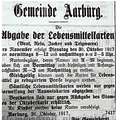
Inserat Abgabe von Lebensmittelkarten (Zofinger Tagblatt)