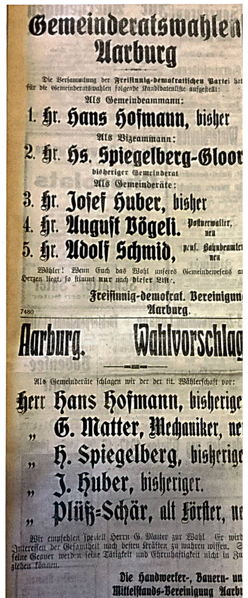
Inserate Gemeinderatswahlen Aarburg. So sah Wahlpropaganda 1917 aus.