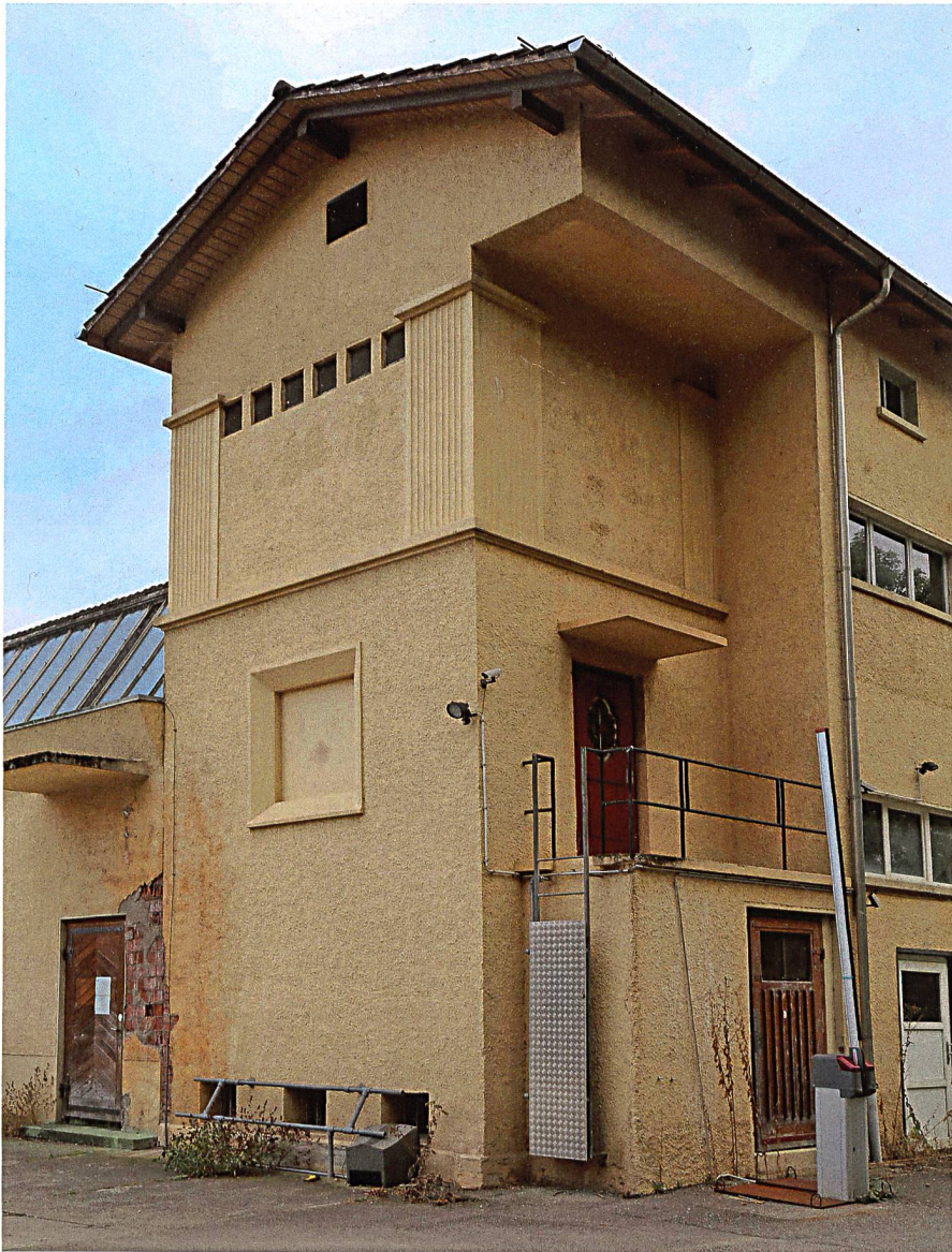
Die Transformatorstation bei der ehemaligen Gerberei Hagnauer ist heute noch in Betrieb.