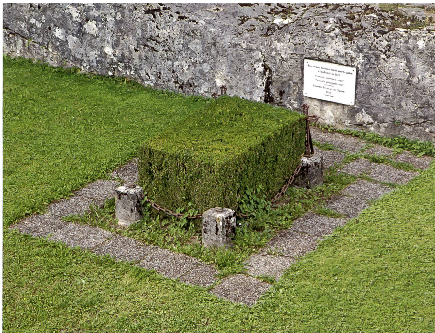
Die vier 1871 in Aarburg verstorbenen Internierten bekamen 1912 auf dem Richtplatz der Festung ihre letzte Ruhestätte.

Jakob Bolliger: Aarburg. Festung, Stadt und Amt (Ausgabe 1998)