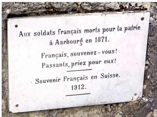
Inschrift auf der Gedenktafel beim Grab auf dem Richtplatz.

geführt, gepflegt, wenn möglich sogar auf ein warmes Lager gebracht. Nicht enden will die schleppend dahinziehende Kolonne. Viele Hunderte sind schon an unsern verwunderten Augen vorbeigezogen, den schützenden Räumen der Festung und der Landhäuser zu.