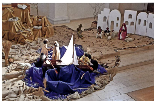
Die Jünger von Jesus sind auf dem See Genesareth in einen Sturm geraten.